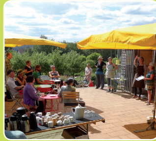
Veranstaltungen und Kurse der GartenWerkStadt