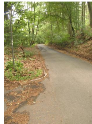
Weiterführung im Allnatal