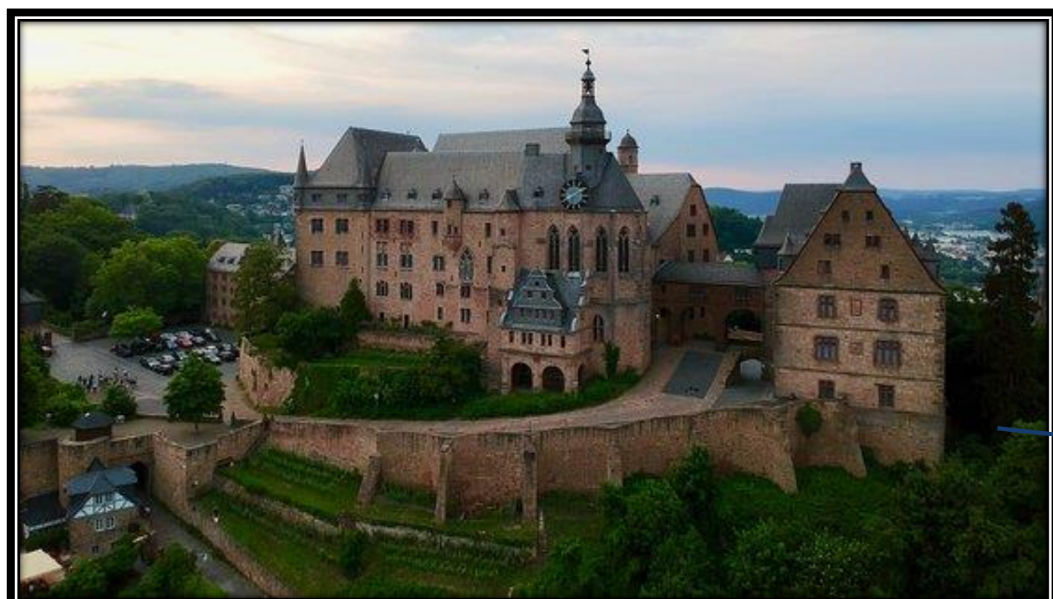
Schloss und Schlossmuseum