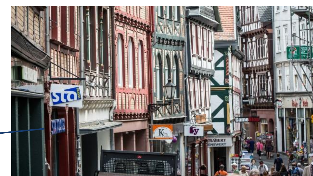
Vielfalt in der Oberstadt