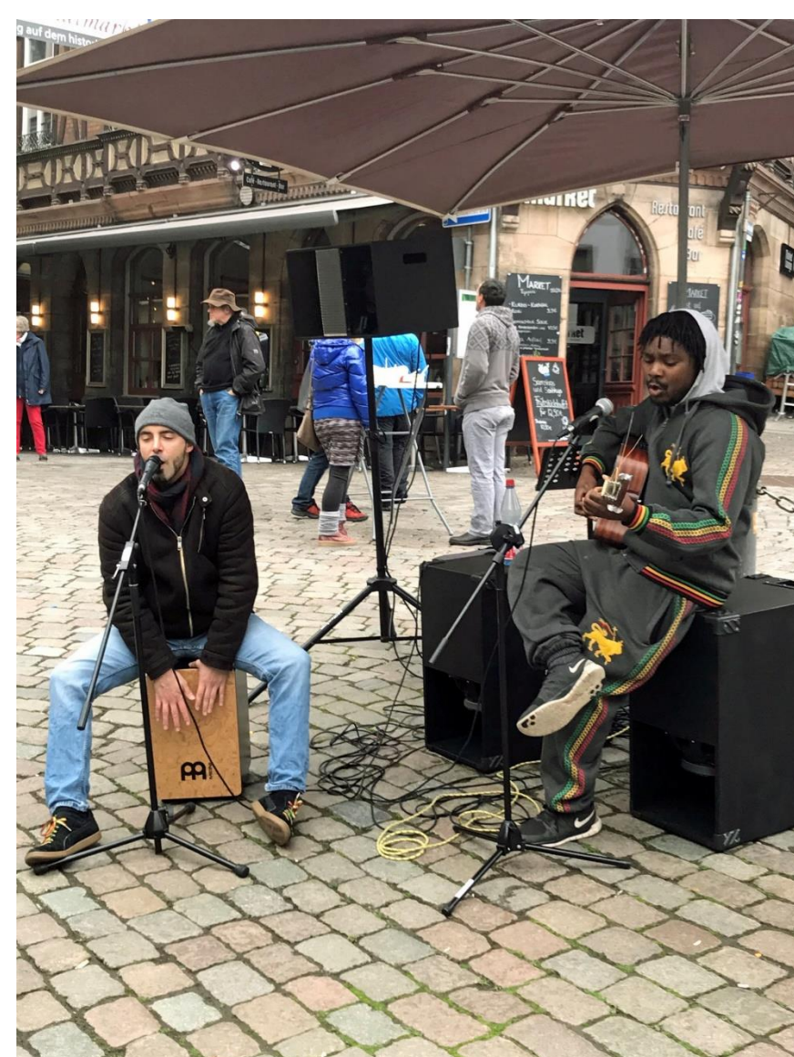
Kultur Mobil am Marktplatz