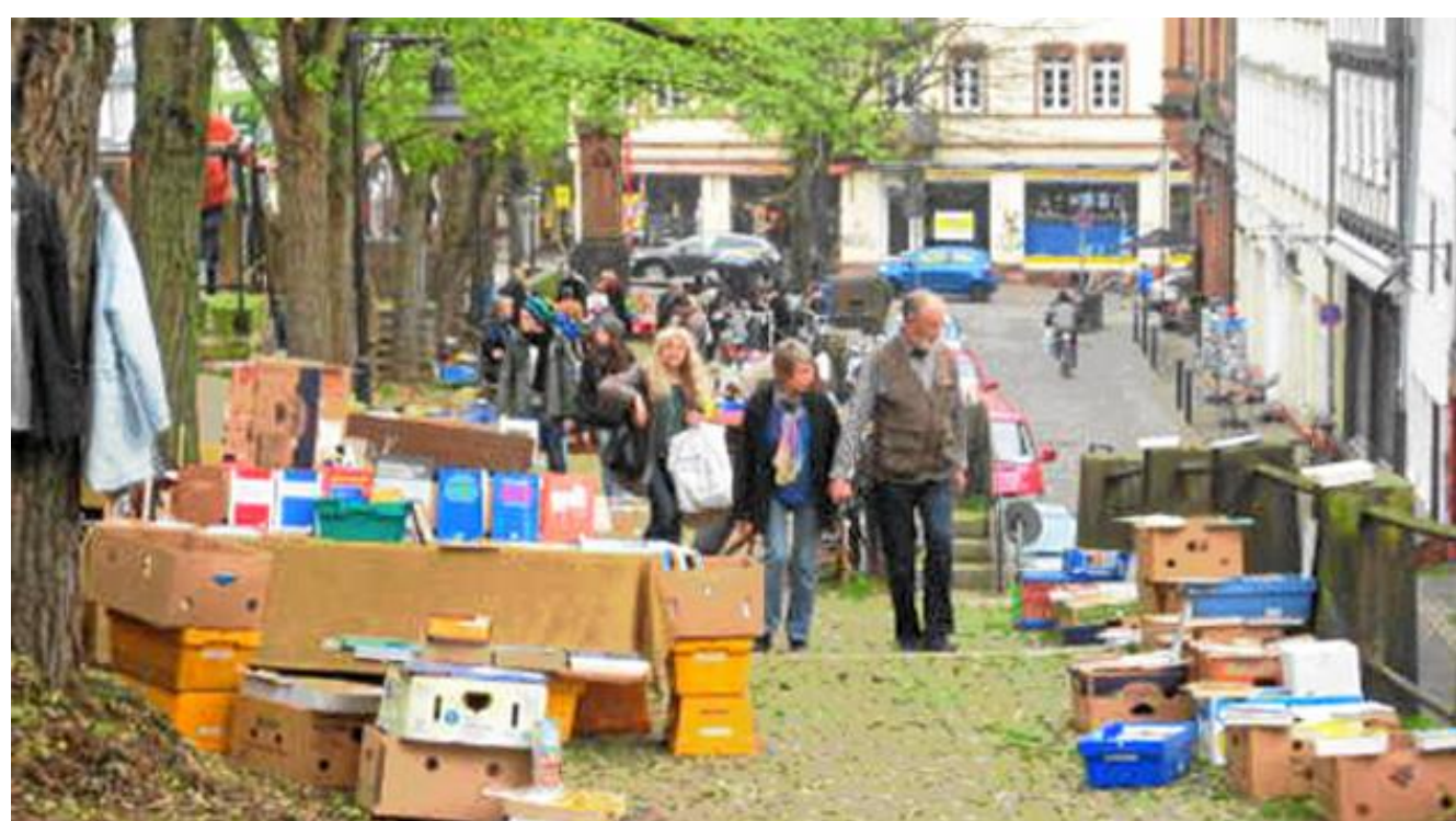
Flohmarkt am Steinweg