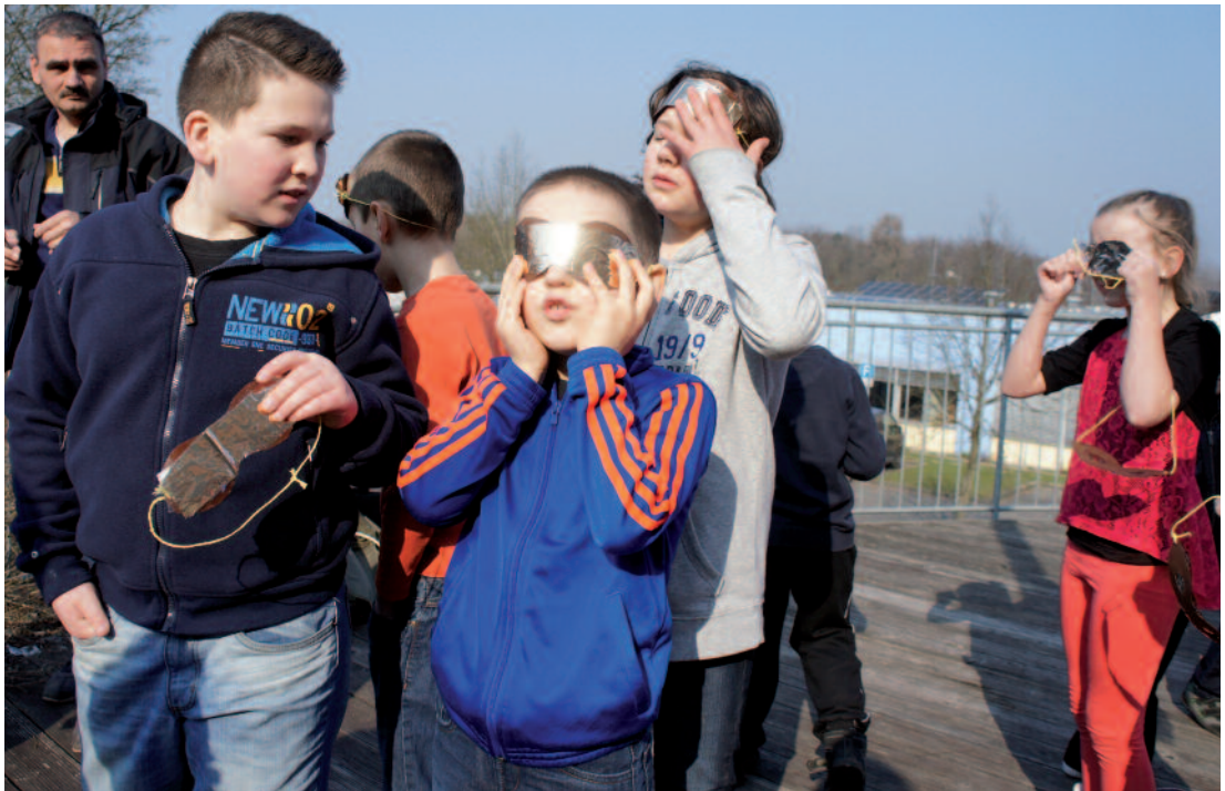
Kinder mit Schutzbrillen zum Blick auf die Sonnenfinsternis