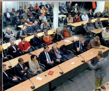
Gefragt: Marburgs Stadtforum zur Zeitenwende - Chancen für den regionalen Onlinemarkt im Einzelhandel.