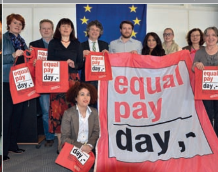
Gleiche Bezahlung für Frauen und Männer: Equal Pay Day setzt mit Rabattaktion für Frauen Zeichen.