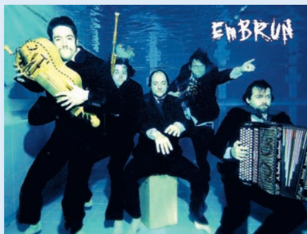
EmBrun BalFolk aus Belgien So 12.4. 20.00, KFZ