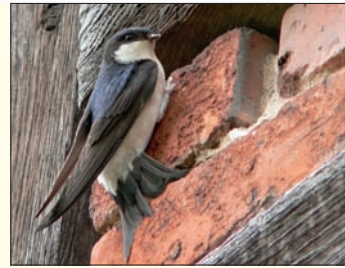
Wer den Schwalben helfen möchte, wird von der Stadt unterstützt.

Für die Rauch- und Mehlschwalben, die als Frühlingsboten im April aus Afrika zurückkehren, stellt die Universitätsstadt Marburg Ihnen kostenlos Nisthilfen zur Verfügung. Hierzulande sind diese Vögel zwar noch anzutreffen, aber durch den Wandel der Landschaft und modernes Wirtschaften in der Tierhaltung verschwinden ihre Nahrungs- und Nistplatzangebote. Nester der Mehlschwalben sind meist an Hausfassaden direkt unterhalb des Dachsprungs zu finden. Die Rauchschnalben brüten im Inneren von Gebäuden. Die Nisthilfen, ein Faltblatt mit Tipps und näheren Informationen zum Schwalbenprojekt gibt es bei der Unteren Naturschutzbehörde: (06421) 201-711 oder -708, E-Mail: gruenflaechen@marburg-stadt.de .