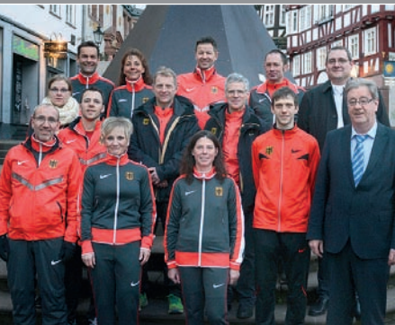
Ausdauer: Nationalteam der 24-Stunden-Läufer nach Wettkampf im Marburger Rathaus begrüßt.