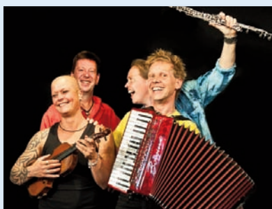
Di Chuzpenics Klezmer und jiddische Lieder aus Kiel So 5.4. 19.00, Waggonhalle