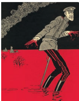
Motive wie „Macbeth - Nikolajewitsch“ aus dem Simplicissimus zeigt das Staatsarchiv.

ter anderem 77 Ochsen und 191 Kälber für die Bewirtung der Gäste geschlachtet wurden und 1873 Pferde in der Stadt und den umliegenden Dörfern untergebracht werden mussten. Der Autor nimmt die Leser und Leserinnen mit auf eine Zeitreise durch 1000 Jahre Stadtgeschichte von den ersten Anfängen der Besiedlung des Schlossberges bis zum Bau des Medienzentrums am alten Botanischen Garten - und das alles historisch genau und gut lesbar. Dafür wurden Inhalt und Layout aktualisiert und erweitert. Zahlreiche Abbildungen und eine Stammtafel aller hessischen Herrscher bis 1918 ergänzen den Text. Erhältlich ist das Buch „Marburg. Kleine Stadtgeschichte“ für 12,90 Euro im Buchhandel.