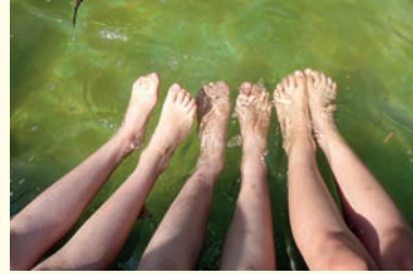
Im Sommer draußen was erleben: Das ist in den Ferienkursen der Familienbildungsstätte möglich.

Die Evangelische Familienbildungsstätte (fbs) bietet Kindern abenteuerliche Sommerferien - mit Action in der Natur, einer Entdeckungsreise ins Mittelalter oder Zauberbildern. Qualifizierte Teams betreuen dabei von 8 bis 15 Uhr. Vom 27. bis 31. Juli startet die fbs mit der „Action-Ferienwoche“ im Wald und in der Stadt. Zur gleichen Zeit gibt es das Angebot „Raus aus der Schule, rein in die Natur“. Am 3. August können Kinder beim „mittelalterlichen Spektakulum“ viel über das Leben im Mittelalter erfahren. Wiesenpower und Heilkräft verspricht eine weitere Ferienwerkstatt: Pflanzen werden im „Heiligen Grund“ aufgespiert, gesammelt und zu leckerem Essen verarbeitet. Malfreudige Kids gestalten ab dem 3. August bunte Zauberbilder. Erstmals gibt es auch in der dritten Woche Kurse: Bei „Alles was fliegt“ werden Flugobjekte gebaut, der Parallelkurs heißt „Farbe tanken“. Kontakt und Anmeldung: www.fbs-marburg.de , (06421) 175080.