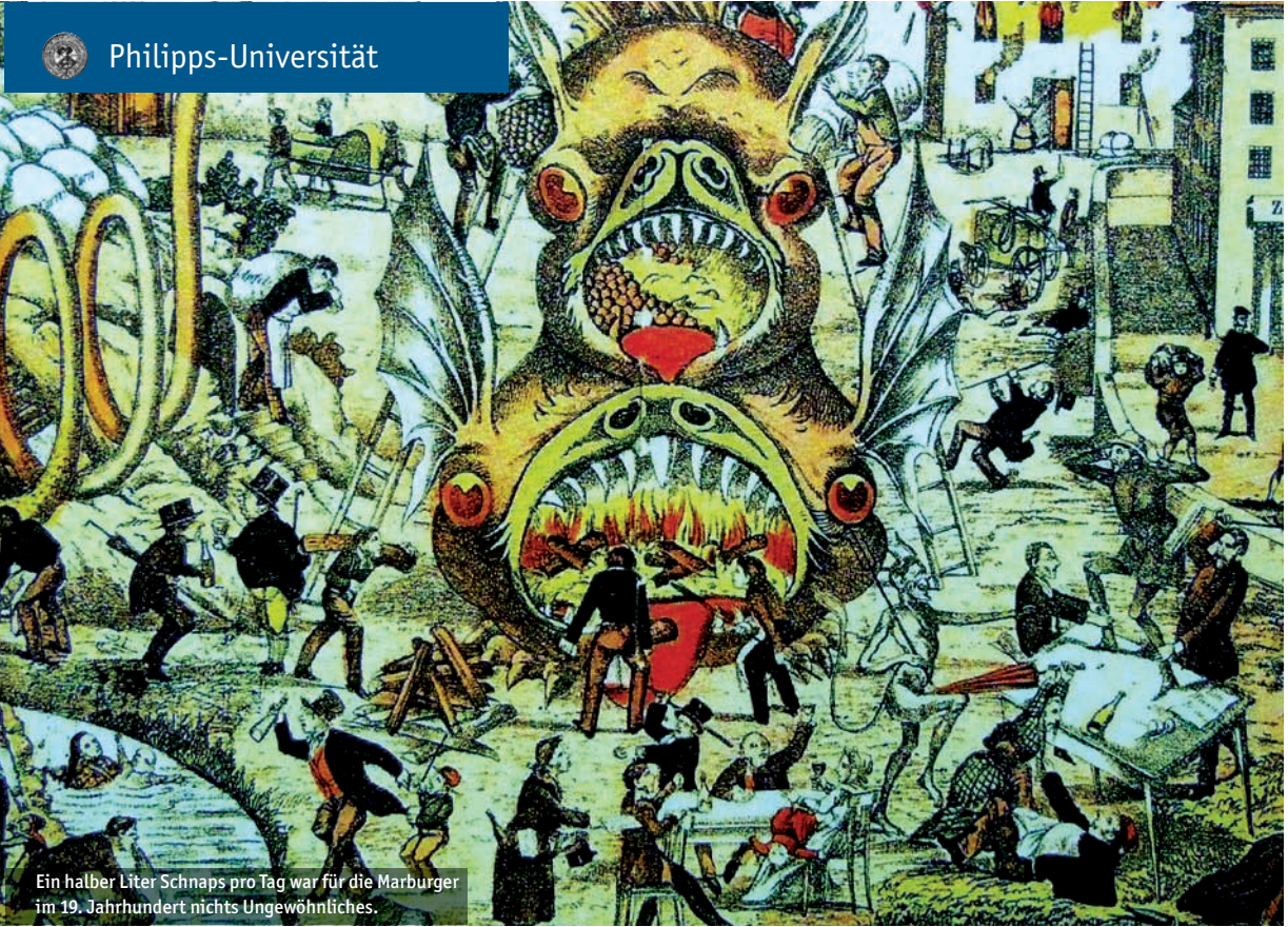
Ein halber Liter Schnaps pro Tag war für die Marburger im 19. Jahrhundert nichts Ungewöhnliches.