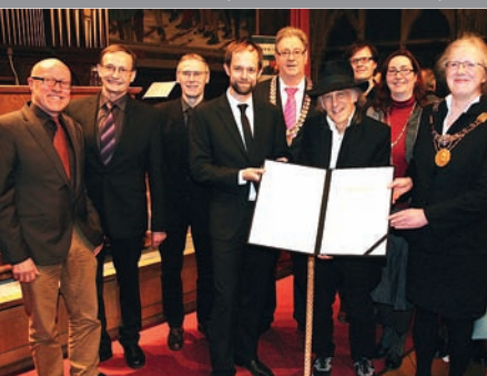
Bewährt: Kameramann Edward Lachman erhält den 15. Marburger Kamerapreis von Stadt und Universität.