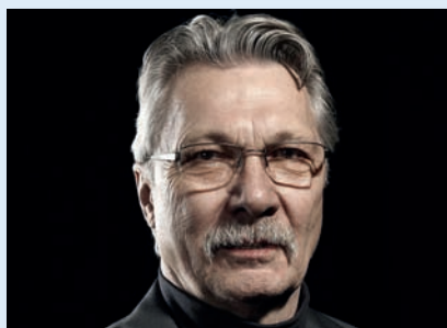
Henning Venske Es war mir ein Vergnügen! Kabarett Fr 17.4. 20.00, KFZ