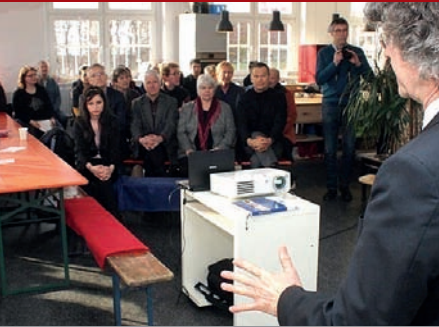
Gesprächsbeginn: Viele Ideen für Programm „Soziale Stadt“ zum Auftakt in Ockershausen/Stadtwald.