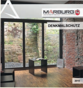
Eine neue Broschüre stellt Denkmalschutzprojekte vor – hier das ehemalige Kurhotel in der Georg-Voigt Straße.