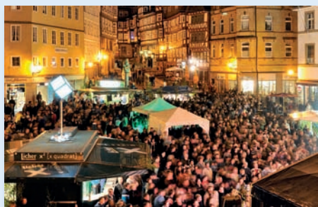
Marburger Maieinsingen Mi 30.4. ab 20.00, Marktplatz