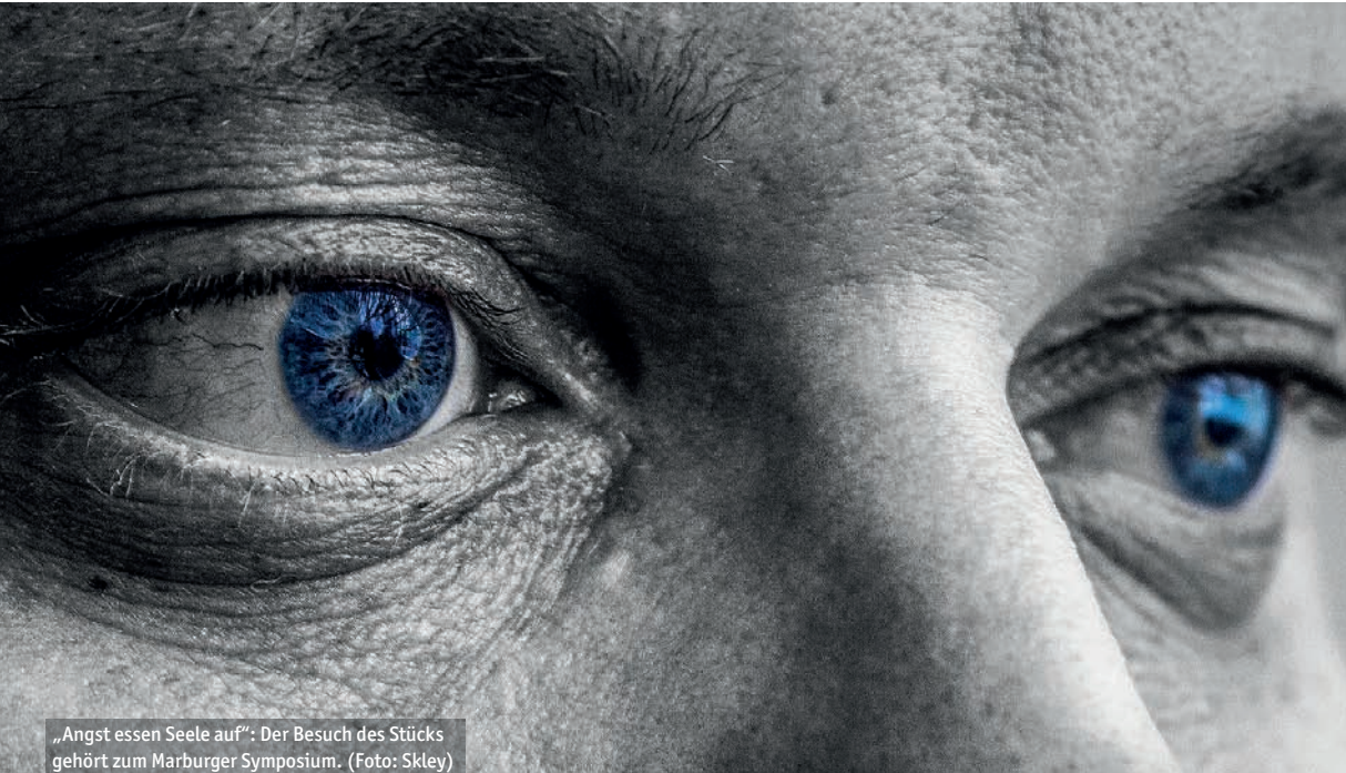
„Angst essen Seele auf“: Der Besuch des Stücks gehört zum Marburger Symposium.

K eine Angst“ - so lautet das Motto des Hessischen Landestheaters Marburg in der laufenden Saison. Mit einem mehrtägigen Symposium will das Team nun dem Phänomen Angst zusammen mit namhaften Wissenschaftlern und Künstlern auf die Spur kommen.