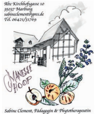
Treffpunkt ist der Manesse Hoop in Ockershausen.