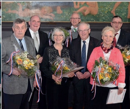
Engagiert: Stadt überreicht vier Landesehrenbriefe und ein Historisches Stadtsiegel an Ehrenamtliche.