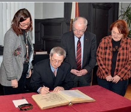
Ehrgast: Der Russische Generalkonsul Jewgenij Schmagin trägt sich ins Goldene Buch ein.