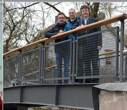
Gut zu Fuß und mit dem Fahrrad: Übergabe der neuen Brücke Auf der Weide/Am Bückingsdamm.