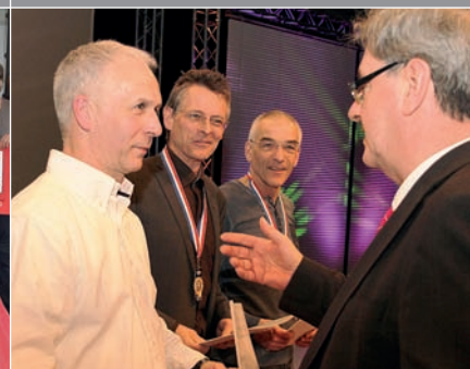
Ausgezeichnet: Sportlerehrung für insgesamt 338 Athletinnen und Athleten der Universitätsstadt Marburg.