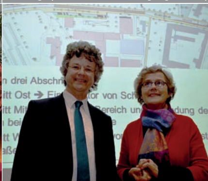
Auf dem Weg: Verkehrsanalyse und Vorschläge für Klimaschutz Schulcampus Leopold-Lucas-Straße.