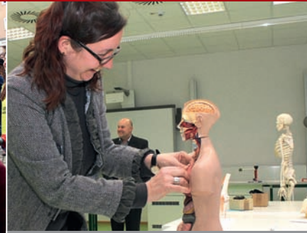
4,5 Millionen für Schulstandort: Sanierter Naturwissenschaften am Gymnasium Philippinum eingeweiht.