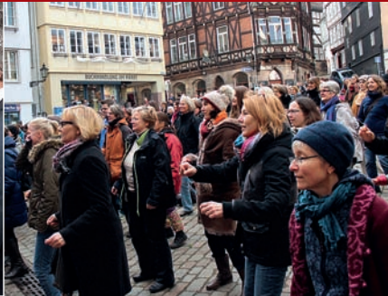
Aufstehen und tanzen: One Billion Rising für Frauenrechte auf dem Marktplatz in Marburg.