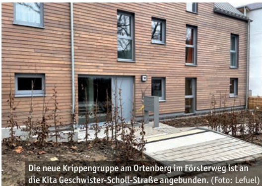
Die neue Krippengruppe am Ortenberg im Försterweg ist an die Kita Geschwister-Scholl-Straße angebunden.

Auch für Kindergartenkinder gibt es weitere Betreuungsplätze. 15 zusätzliche Plätze für Kinder über drei Jahre entstehen im zweiten Halbjahr in der Kita Grünes Haus im Karlsbader Weg. Der dafür benötigte Raum ergibt sich durch den Umzug des „Familiennetzwerkes“ an den Christa-Czempel-Platz. Neben diesen Projekten verfolgt die Stadt Marburg den Ausbau der Betreuungsplätze auch in Wehrda, am Stadtwald und weiteren Stadtgebieten, damit genügend Betreuungsplätze zur Verfügung stehen.