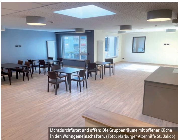
Lichtdurchflutet und offen: Die Gruppenräume mit offener Küche in den Wohngemeinschaften.