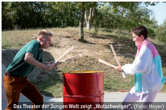
Das Theater der Jungen Welt zeigt „Wutschweiger“.