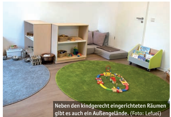
Neben den kindgerecht eingerichteten Räumen gibt es auch ein Außengelände.