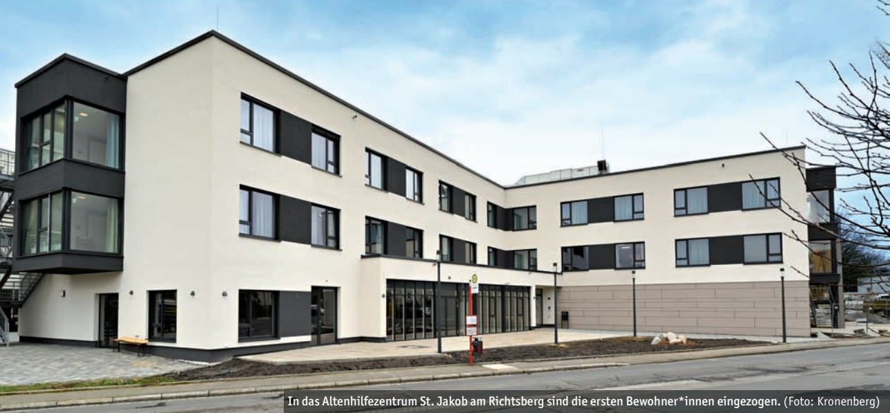
In das Altenhilfezentrum St. Jakob am Richtsberg sind die ersten Bewohner*innen eingezogen.