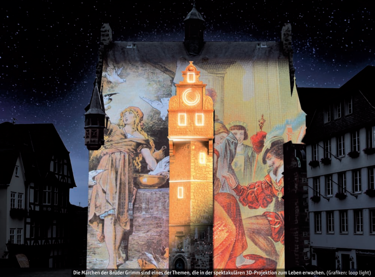
Die Märchen der Brüder Grimm sind eines der Themen, die in der spektakulären 3D-Projektion zum Leben erwachen. (Grafiken: loop light)