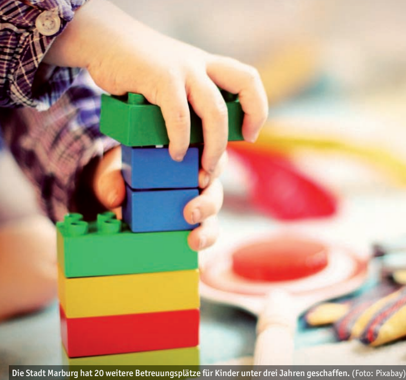
Die Stadt Marburg hat 20 weitere Betreuungsplätze für Kinder unter drei Jahren geschaffen.