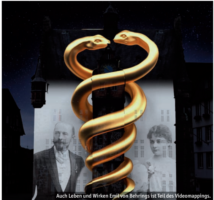
Auch Leben und Wirken Emil von Behrings ist Teil des Videomappings.