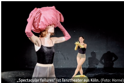
„Spectacular failures“ ist Tanztheater aus Köln.

nen Inseln“. Es gibt Theater für die Kleinsten ab drei Jahren, mehrere Tanz- und Bewegungstheaterproduktionen und Stücke für Teenager*innen mit Themen wie Mobbing oder Selbstoptimierung. Der Festivalpreis wird zum Abschluss am Samstag, 2. April, vor dem Stück „Pollesch wäre das nicht passiert“ des Hessischen Landestheaters Marburg verliehen.