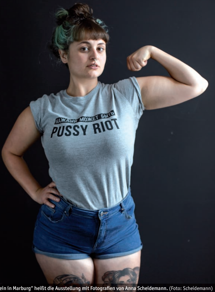
„Frau sein in Marburg“ heißt die Ausstellung mit Fotografien von Anna Scheidemann.