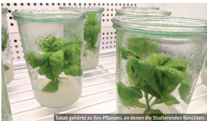
Tabak gehörte zu den Pflanzen, an denen die Studierenden forschten.

Mit ihren Ergebnissen überzeugten die auch von der Universität und zahlreichen Sponsoren unterstützten