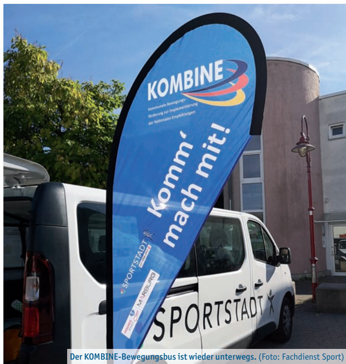
Der KOMBINE-Bewegungsbus ist wieder unterwegs.

Ein ungewöhnliches Theaterprojekt präsentiert das Gleichberechtigungsreferat der Universitätsstadt Marburg zum internationalen Frauentag am 8. März. In einer Bühnenperformance erzählen Frauen mit Fluchterfahrungen ihre Geschichten. Sie zeigen, wie es ihnen in Deutschland geht, was ihnen in ihrem Leben in Marburg und Umgebung hilft, was ihnen Mut macht und was sie an andere Frauen weitergeben möchten. Das Theaterprojekt ist in Kooperation mit dem Büro für Integration des Landkreises, dem städtischen Ausländerbeirat, dem Verein „Arbeit und Bildung“ sowie dem sozialpsychiatrischen Dienst des Landkreises unter der theaterpädagogischen Begleitung von Inga Blix entstanden. Zu sehen ist es ab 18.30 Uhr in der Marburger Waggonhalle, zuvor gibt es eine gemeinsame Besichtigung einer Ausstellung von Frauen mit Fluchterfahrungen. Die Fotoausstellung ist im Rahmen des