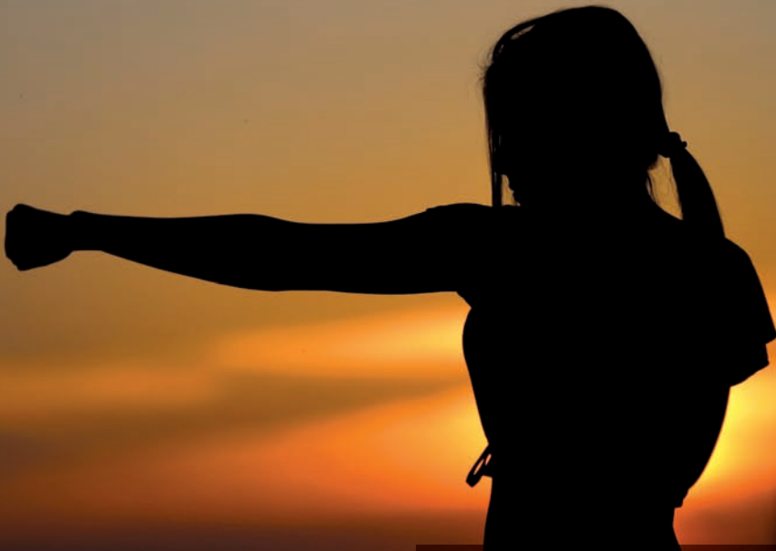
Das Sicherheitstraining vermittelt Techniken zur Selbstverteidigung.