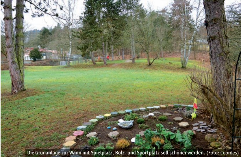
Die Grünanlage zur Wann mit Spielplatz, Bolz- und Sportplatz soll schöner werden.

Ziel des Verfahrens ist es, Anregungen für die weitere Planung aufzunehmen. Für unterschiedliche Bereiche der Fläche werden die Einwohner*innen Wehrdas unter anderem dazu befragt, welche Ideen sie zur Ausgestaltung der Spielplatz- und Sportanlagen haben, welche Vorschläge für Geräte und Begegnungsmöglichkeiten es gibt und wie die unterhalb des Spielplatzes liegende Flä-