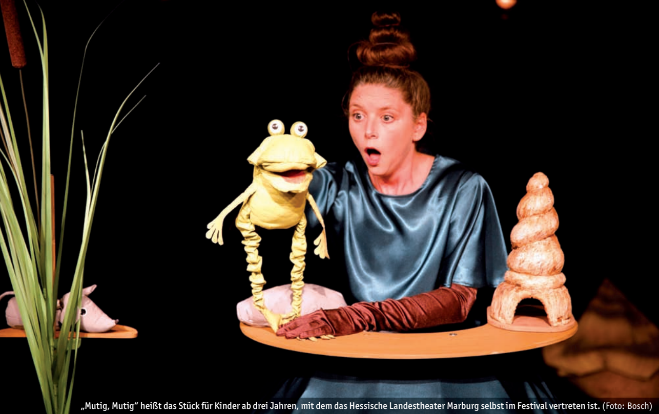
„Mutig, Mutig“ heißt das Stück für Kinder ab drei Jahren, mit dem das Hessische Landestheater Marburg selbst im Festival vertreten ist.