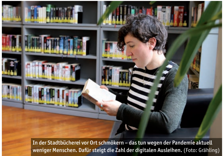
In der Stadtbücherei vor Ort schmökern – das tun wegen der Pandemie aktuell weniger Menschen. Dafür steigt die Zahl der digitalen Ausleihen.

Wer einen Bibliotheksausweis der Stadtbücherei Marburg hat, kann außerdem die interaktive Brockhaus Enzyklopädie kostenlos nutzen, ebenso das Munzinger Archiv oder das Duden Basiswissen Schule. Die Informationen sind qualitätsgesichert, zitierfähig und eignen sich für Prüfungen, Präsentationen, Referate und wissenschaftliches Arbeiten. An der Onleihe des Onleiheverbunds Hessen ( www.onleiheverbundhessen.de ) nehmen mehr als 120 hessische Bibliotheken teil. Hier sind die Kund*innen aus Marburg ganz vorn und liegen mit ihrem Ausleihvolumen an dritter Stelle im gesamten Verbund.