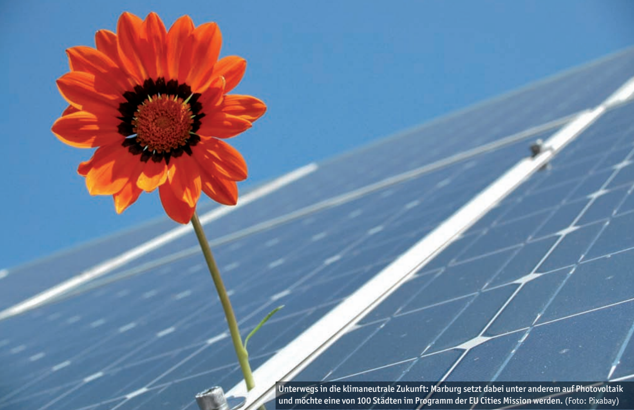
Unterwegs in die klimaneutrale Zukunft: Marburg setzt dabei unter anderem auf Photovoltaik und möchte eine von 100 Städten im Programm der EU Cities Mission werden.

D ie Stadtgesellschaft hat sich ein ehrgeiziges Ziel gesetzt: Marburg soll bis 2030 klimaneutral sein. Da passt es, dass die EU nun 100 Städte und Regionen in ganz Europa dabei fördern möchte, genau dies zu erreichen. Die Stadt Marburg hat sich um einen Platz bei der EU Cities Mission „100 climate-neutral and smart european cities by 2030“ beworben.