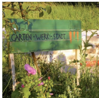
Die Gartenwerkstatt findet man im Park der Vitos-Klinik.

eine Auftrittsmöglichkeit für Marburger Musiker*innen, die erneut einen Winter mit wenigen Konzertveranstaltungen erleben mussten.“ Die Lokale Allianz für Menschen mit Demenz ist ein Zusammenschluss von 15 Organisationen, die Demenzbetroffene und deren Angehörige unterstützen und sich für ein demenzfreundliches Marburg einsetzen. Neben der Alzheimer Gesellschaft und anderen Initiativen wirkt auch der Fachdienst Altenplanung an der Lokalen Allianz mit.