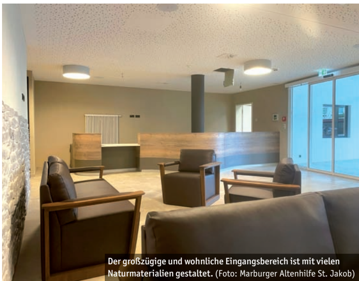
Der großzügige und wohnliche Eingangsbereich ist mit vielen Naturmaterialien gestaltet.

Beim Ausbau hat auch der Klimaschutz eine große Rolle gespielt. Das Gebäude hat eine 18 Zentimeter dicke Dämmschicht mit Brandriegeln und eine Drei-Scheiben-Wärmeschutzverglasung erhalten. Es verfügt über eine kontrollierte Lüftungsanlage mit Wärmerückgewinnung und wird ans Fernwärmenetz angeschlossen. Die Fernwärme wird in der Richtsberg-Gesamtschule über ein Blockheizkraftwerk erzeugt und versorgt auch die Astrid-Lindgren-Schule und weite Teile des oberen Richtsbergs. Ergänzt wird das energetische Konzept durch eine große Photovoltaik-Anlage. „Wir erwarten eine Stromernte von rund 100.000 Kilowattstunden pro Jahr“, so Jürgen Rausch. Außerdem wurden unterirdisch Wasserbehälter verbaut, die rund 15.000 Liter Regenwasser sammeln können. Mieterin ist die Marburger Altenhilfe St. Jakob. Sie hat sich die Aufgabe gestellt, das Leben älterer Menschen und das von deren Angehörigen zu erleichtern. Und das unabhängig davon, ob ein neues Zuhause gesucht wird, nur eine begrenzte Unterstützung erforderlich ist oder eine Tagespflege benötigt wird.