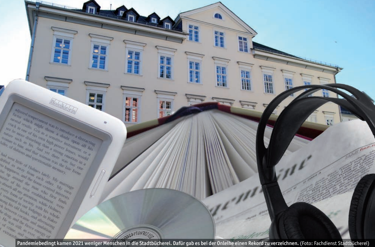
Pandemiebedingt kamen 2021 weniger Menschen in die Stadtbücherei. Dafür gab es bei der Onleihe einen Rekord zu verzeichnen.