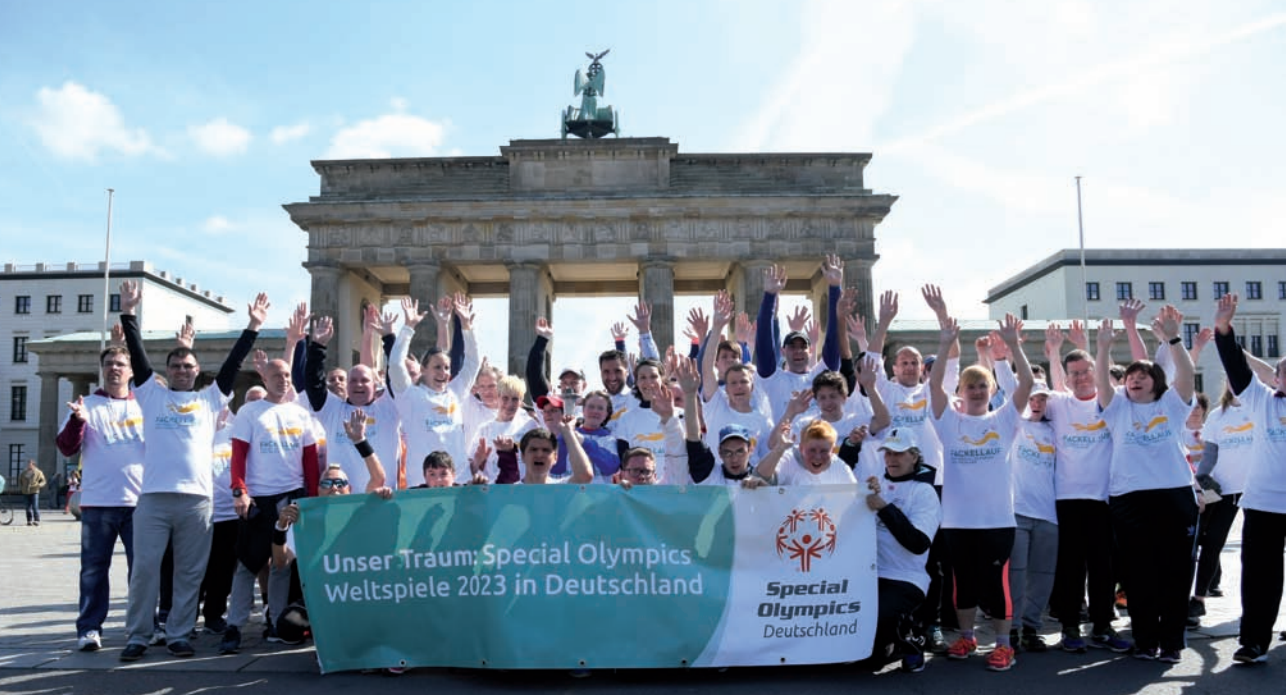
Bei einem Fackellauf von Special Olympics Deutschland 2018 in Berlin träumten die Teilnehmer*innen schon von den Weltspielen in Berlin 2023 – im kommenden Jahr geht der Traum in Erfüllung und auch Marburg ist als „Host Town“ dabei.