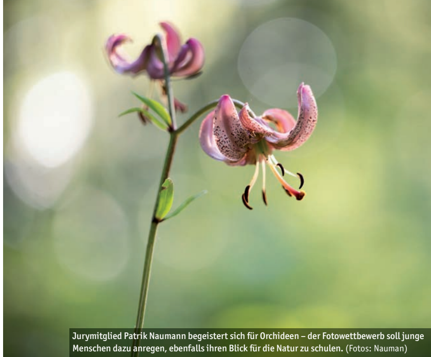
Jurymitglied Patrik Naumann begeistert sich für Orchideen – der Fotowettbewerb soll junge Menschen dazu anregen, ebenfalls ihren Blick für die Natur zu schulen.

Begleitet wird der Wettbewerb von dem erfahrenen Naturfotografen Patrik Naumann. Der findet das Projekt wichtig und reizvoll zugleich: „Naturfotografie bedeutet immer auch, seinen Blick zu schulen und aufmerksam hinzusehen. Diese Fähigkeiten bilden die Grundlage für unseren Umgang mit der Natur und den Einsatz für ihren Schutz.“ Er selbst entwickelte im Laufe der Jahre beispielsweise ein besonderes Interesse für wilde Orchideen. Da die meisten Sorten mittlerweile vom Aussterben bedroht sind, will er mit seinen Bildern zeigen, wie besonders und damit auch schützenswert diese Blumen sind. Patrik Naumann unterstützt das Projekt neben seiner fachlichen Expertise auch als Mitglied der mehrköpfigen Auswahljury. Die hat nach dem Annahmeschluss am Montag, 25. April, die Aufgabe, die Gewinner*innenbilder auszuwählen. Bei der Frage nach