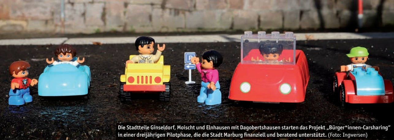
Die Stadtteile Ginseldorf, Moischt und Elnhausen mit Dagobertshausen starten das Projekt „Bürger*innen-Carsharing“ in einer dreijährigen Pilotphase, die die Stadt Marburg finanziell und beratend unterstützt.