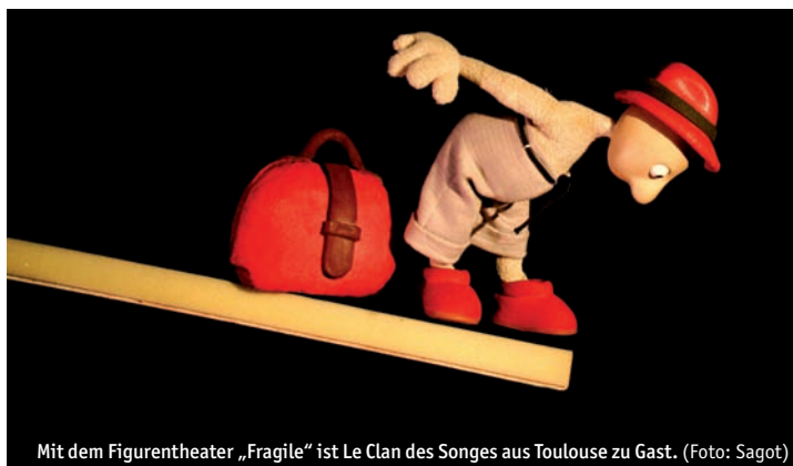
Mit dem Figurentheater „Fragile“ ist Le Clan des Songes aus Toulouse zu Gast.

Offiziell eröffnet wird das Festival mit dem außergewöhnlichen Puppenspiel des Theater Waldspeicher aus Erfurt und dem Stück „Atlas der abgelegte-