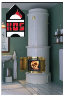
Kamin-Ofen-Scheune 35043 MR-Cappel • Moischer Str. 10 Tel. 0 64 21/4 71 85

Kontakt und weitere Informationen: www.auslaenderbeirat-marburg.de