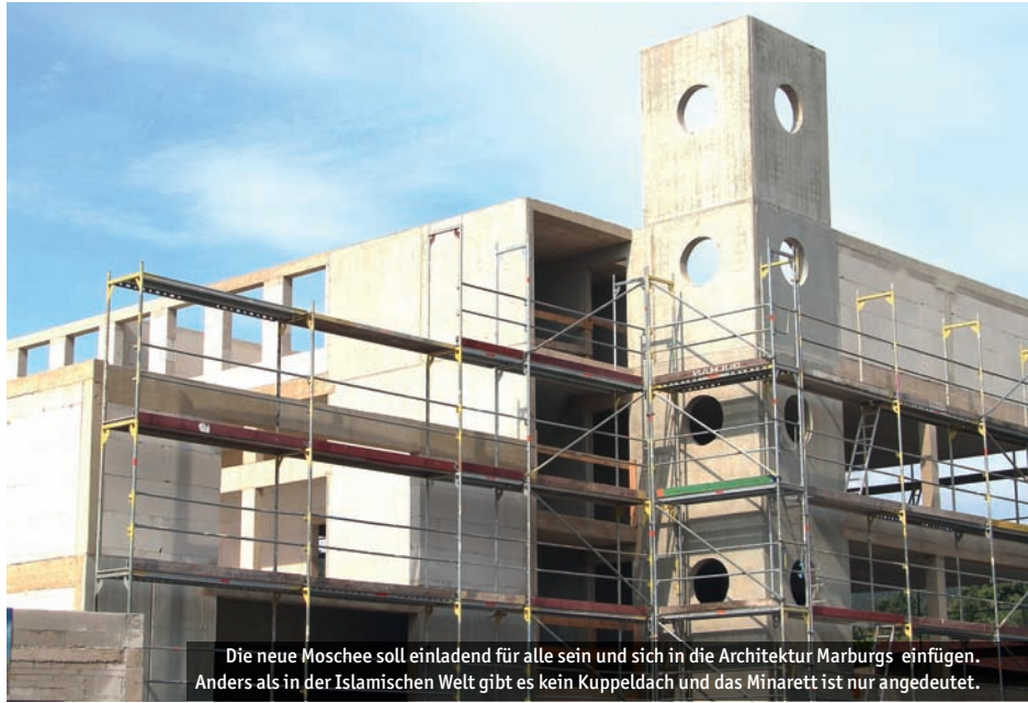
Die neue Moschee soll einladend für alle sein und sich in die Architektur Marburgs einfügen. Anders als in der Islamischen Welt gibt es kein Kuppeldach und das Minarett ist nur angedeutet.

Das Herzstück bildet dabei die Moschee. Der 200 Quadratmeter große Gebetsraum im Erdgeschoss bietet Platz für 200 Gläubige – so viele Muslime kommen derzeit zum Frei-