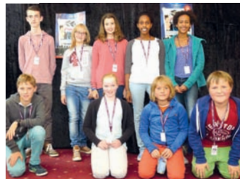
Besonderheit von Final Cut: die Kinder- und Jugendjury des Festivals – hier die Preisrichter des letzten Jahres.

Vom 5. bis 11. Oktober feiert das Marburger Kinder- & Jugendfilmfestival Final Cut ein kleines Jubiläum. Bereits zum zehnten Mal zeigt das cineastische Programm für die Jüngsten europäische Filme herausragenden Formats. In den Wettbewerben Kinder- und Jugendfilm treten Filme für die ganz Kleinen bis hin zu Filmen für junge Erwachsene an. Es gilt als Marburger Besonderheit, dass die Preisträger ausschließlich von einer Kinder- und Jugendjury bestimmt werden. Mit einem verlockenden Sondereintrittspreis von nur drei Euro soll die Hemmschwelle für den Kinobesuch gering gehalten werden. Alle Filme werden zusätzlich auch in Vorstellungen am Vormittag für Schulklassen mit Filmgesprächen angeboten.