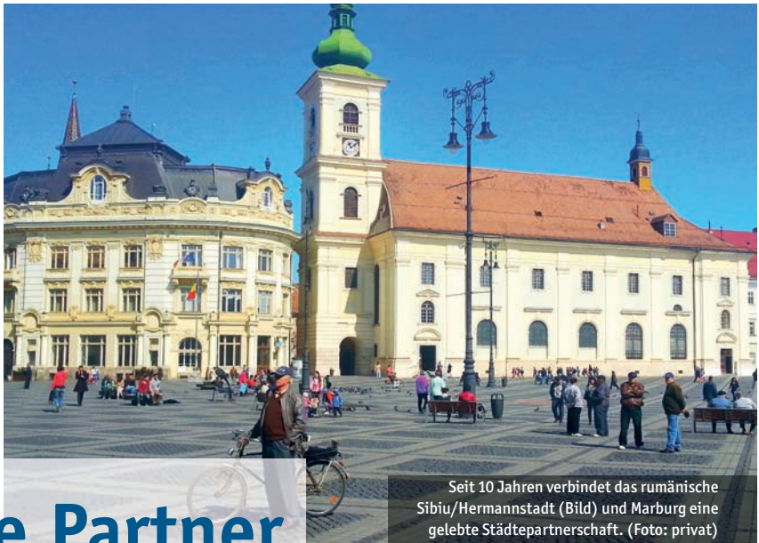
Seit 10 Jahren verbindet das rumänische Sibiu/Hermannstadt (Bild) und Marburg eine gelebte Städtepartnerschaft.