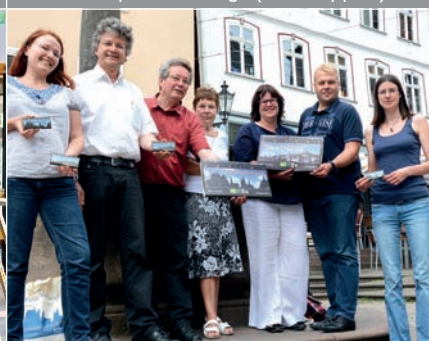
„Der Marburger“ zum Anbeißen: Zweite Stadtschokolade mit Fairtrade-Siegel vorgestellt.