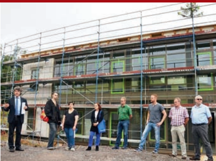
„Für einen glücklichen Start ins Leben“: Richtfest der Kita mit Familienzentrum im Karlsbader Weg gefeiert.