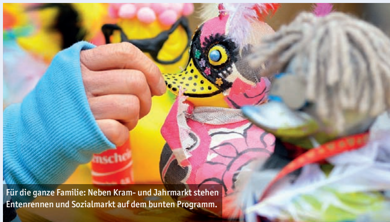
Für die ganze Familie: Neben Kram- und Jahrmarkt stehen Entenrennen und Sozialmarkt auf dem bunten Programm.

■ Kuriositäten: Viele eigenartige Dinge gibt es im Rahmen des Kuriositätenjahrmarktes am Sonntag von