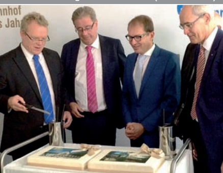
Ausgezeichnet: Der Hauptbahnhof mit seinem neuen Vorplatz wurde als „Bahnhof des Jahres“ prämiert.