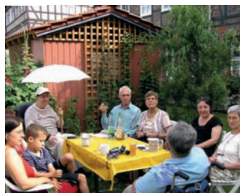
Gemeinschaftliche Wohnformen werden am 10. Oktober an drei Standorten allen Interessierten vorgestellt.

Wie wollen wir später leben? Und wohnen? Die häufigste Antwort darauf: Am liebsten selbstbestimmt und in vertrauter Umgebung. Immer mehr Menschen fragen und suchen dabei nach gemeinschaftlichen Wohnformen. Sie möchten in der eigenen Wohnung leben und etwas füreinander und miteinander tun. Den Wunsch nach lebendiger und gelebter Nachbarschaft haben Familien und Alleinerziehende ebenso wie allein lebende und ältere Menschen. In Marburg gibt es bereits