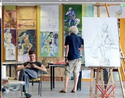
Kunst erleben: Die Sommerakademie 2015 stellte sich „transparent“ der Öffentlichkeit in Marburg vor.