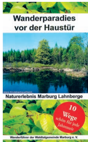
Die Waldtalgemeinde hat einen Wanderführer für jede Jahreszeit auf den Lahnbergen herausgegeben.