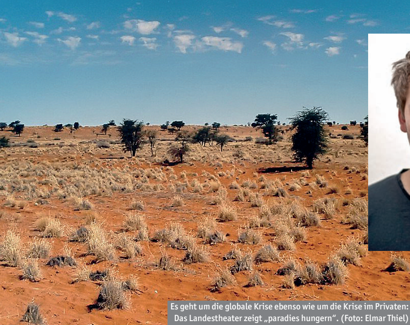
Es geht um die globale Krise ebenso wie um die Krise im Privaten: Das Landestheater zeigt „paradies hungern“.