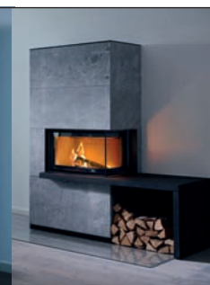
Kachel-Ofen-Systeme 35369 Gießen • Marburger Straße 240 Tel. 06 41/7 19 70