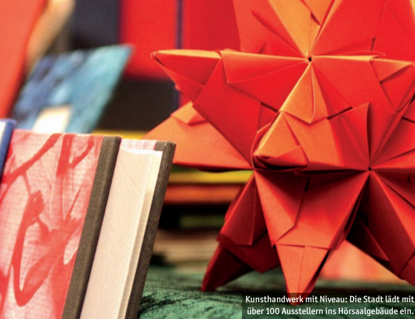
Kunsth Handwerk mit Niveau: Die Stadt lädt mit über 100 Ausstellern ins Hörsaalgebäude ein.

Seifen sowie kreative Kinderkleidung gehören genauso zum Angebot wie eindrucksvolle Lichtobjekte oder ausgefallene Holz-, Metall-, Gebrauchs- oder Dekorationsgegenstände für Haus und Garten.