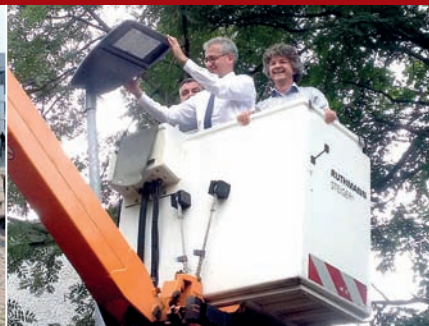
Energie sparen: Die Stadt hat die Hälfte der Straßenlampen als Landesmodell auf LED-Technik umgerüstet.