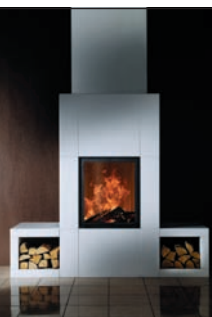
K - O - S Dipl.-Ing. E. Heuser www.kos-kamine.de