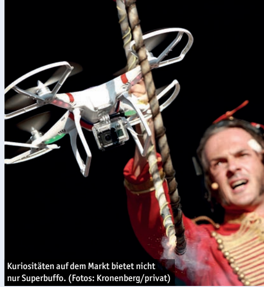
Kuriositäten auf dem Markt bietet nicht nur Superbuffo.

Entenrennen: Für das Weidenhäuser Entenrennen, das Sonntag ab 13 Uhr stattfindet, schmücken die Teilnehmer Hunderte von Gummienten, um sie auf der Lahn zu Wasser zu lassen - ein Spektakel für die ganze Familie.