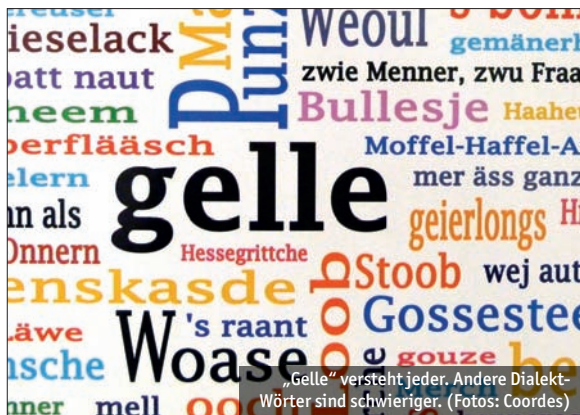
„Gelle“ versteht jeder. Andere Dialektwörter sind schwieriger.

„Hessen bietet die komplexeste Sprachlandschaft, die wir haben, weil wir auf relativ kleinem Raum relativ viele Dialekte finden“, so der Experte. Dabei breitet sich der Frankfurter Dialekt seit Jahren aus. Inzwischen wird er selbst in Gießen