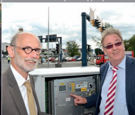
Erfolgreich beendet: Nach der Sanierung ist die Kreuzung Beltershäuser Straße/ Capperler Straße freigegeben.