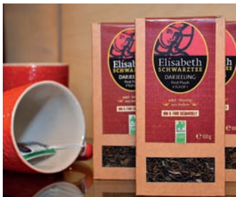
Fairtrade-Stadt: Marburg wird nach erneuter Prüfung eine Vorreiterrolle bescheinigt.

kontinuierlichen Engagement eine Vorreiterrolle ein. Erst kürzlich wurde die zweite Stadtschokolade „Der Marburger“ mit Zutaten aus kontrolliert biologischem Anbau mit dem