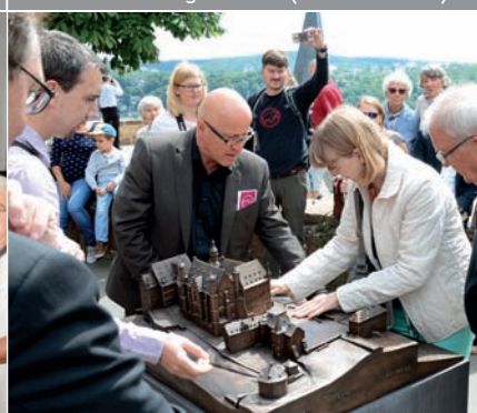
Zur Ausstellung „Stadt Land Schloss“ wurde auch ein Tastmodell des Schlosses eingeweiht.