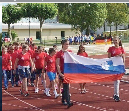
Internationale Begegnung: Jugendliche aus den Partnerstädten kamen zum Six Nations Cup in Marburg.