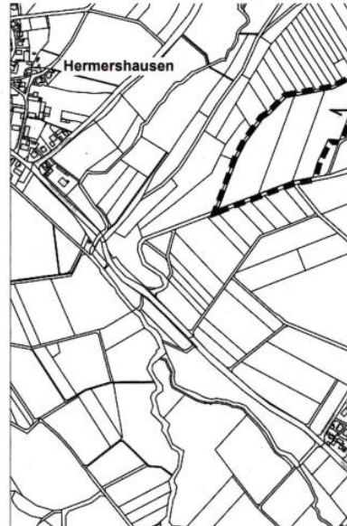
(Ausschnitt zum derzeitigen Planungsstand)