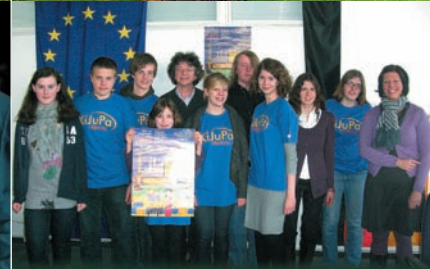
Startklar für die neue Legislaturperiode: Mitglieder des neuen Kinder- und Jugendparlaments – kurz: KiJuPa (3.3.11)

Über 600 Gäste nutzten die Gelegenheit, beim 6. Internationalen Suppenfest auf dem Richtsberg aus fremden Töpfen zu kosten. (26.2.11)