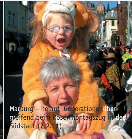
Marburg – hetaul! Generationenübergreifend beim Rosenmontagszug in der Südstadt (7.2.11)