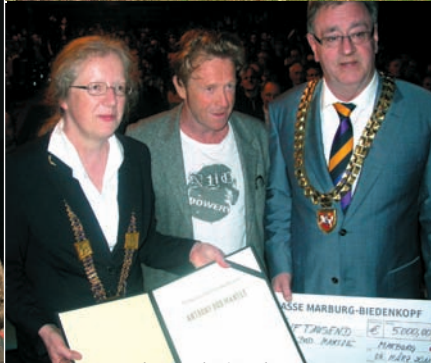
Anthony Dod Mantle ist der Träger des mit 5.000 Euro dotierten Marburger Kamerapreises 2011(4.3.11)