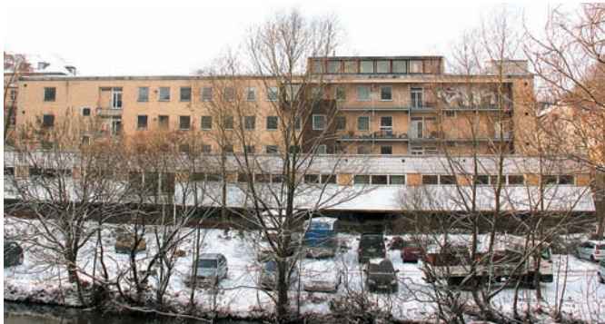
Das Bettenhaus ist ein selbstverwaltetes Studierenden-Wohnheim in der Emil-Mannkopf-Straße und soll auch künftig Wohnraum mit sozialverträglichen Mieten bereithalten.

hört dazu. Für Fußgänger, Fahrräder, den öffentlichen Personennahverkehr und für Pkw. Vieles haben wir in den vergangenen Jahren getan – wie z.B. den Neubau des wunderschönen und endlich barrierefreien Hirsefeldsteges. Aber vieles ist zu tun. Wir hoffen weiterhin auf eine aktive Beteiligung aller an Diskussionsprozessen und an Projektumsetzungen. Am Solarstromprojekt können sich alle nach wie vor beteiligen, um Marburg für die solare Zukunft fit zu machen. Wer das eigene Dach bestücken will: Das neue Marburger Solarkataster gibt verlässliche Auskunft.