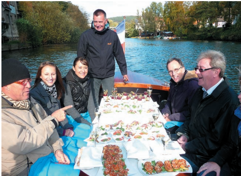
Eine Bootsfahrt, die ist lustig ... auch im Jahr 2011.