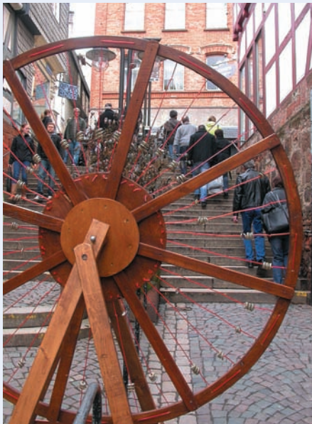
Ein neues Rad gefällig?