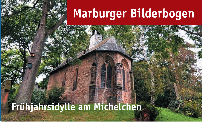
Frühjahrsidylle am Michelchen

276 mal sagt die Stadt erfolgreichen Sportlerinnen und Sportlern, sowie engagierten Ehrenamtlichen Dank. (11.3.11)