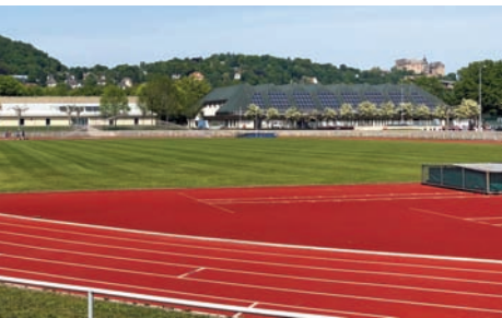
Auch die Infrastruktur – wie das Georg-Gaßmann-Stadion – ist Thema bei der Sportentwicklungsplanung.

Ende in einer kooperativen Planungsgruppe beraten. Daraus werden Handlungsempfehlungen entwickelt, die im Herbst 2022 vorliegen sollen. Weitere Informationen gibt es beim Fachdienst Sport unter (06421) 201-1180 oder per Mail unter bjoern.bacques@marburg-stadt.de .