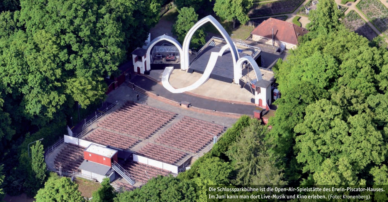
Die Schlossparkbühne ist die Open-Air-Spielstätte des Erwin-Piscator-Hauses. Im Juni kann man dort Live-Musik und Kino erleben.