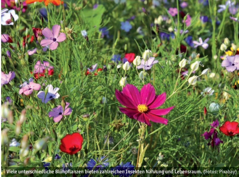
Viele unterschiedliche Blühpflanzen bieten zahlreichen Insekten Nahrung und Lebensraum.