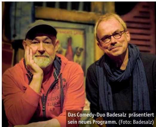
Das Comedy-Duo Badesalz präsentiert sein neues Programm.