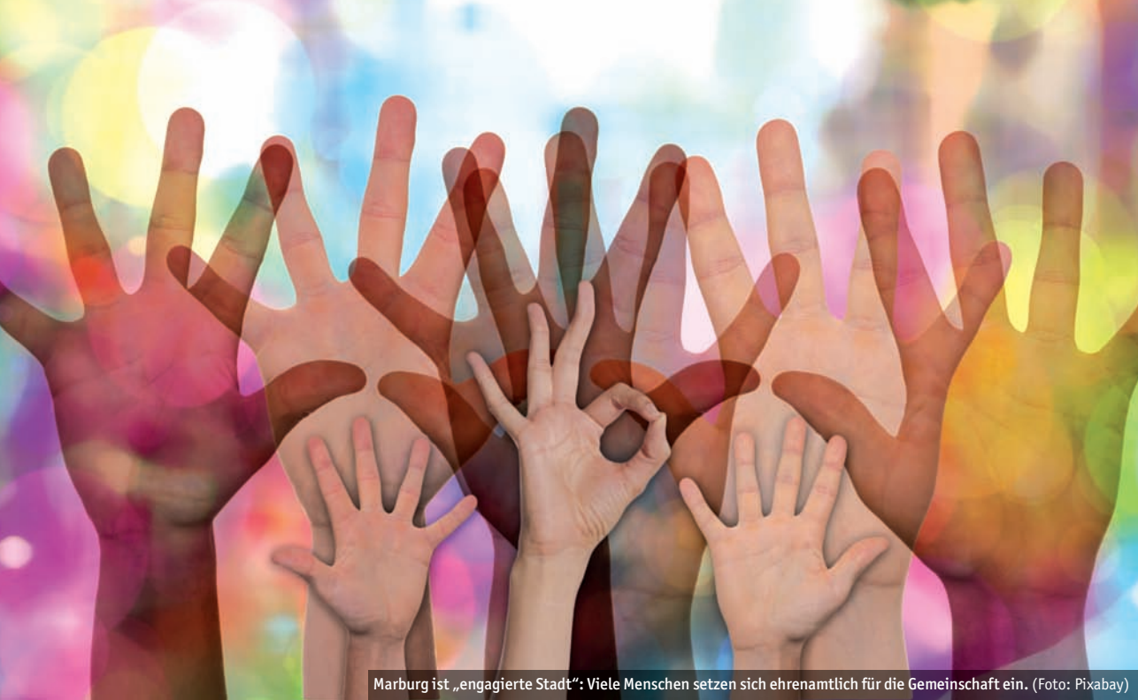
Marburg ist „engagierte Stadt“: Viele Menschen setzen sich ehrenamtlich für die Gemeinschaft ein.