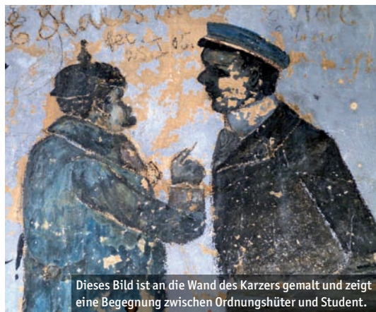
Dieses Bild ist an die Wand des Karzers gemalt und zeigt eine Begegnung zwischen Ordnungshüter und Student.