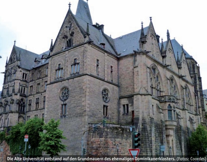
Die Alte Universität entstand auf den Grundmauern des ehemaligen Dominikanerklosters.