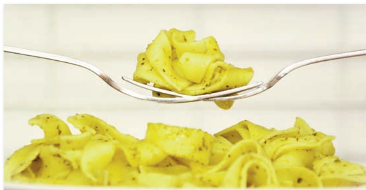
Das warme Mittagessen an den Schulen wird für die Familien nicht teurer.

Unter dem Titel „Zukunftsgerechte Energie für alle“ setzt die Volkshochschule Marburg ihre Mobilitätsreihe fort. Ziel ist es, Bedürfnisse der Mobilität mit klimagerechten, ökologischen und sozialen Zielen in Einklang