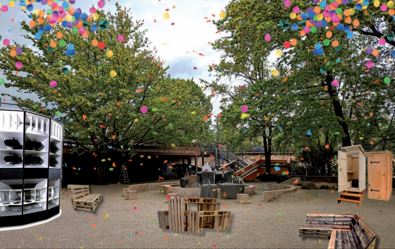
Drei Jugend-Kultur-Festivals bietet Marburg800 an verschiedenen Locations. Das Musiclab im Juli hat vier Areas rund um den Rudolphsplatz.