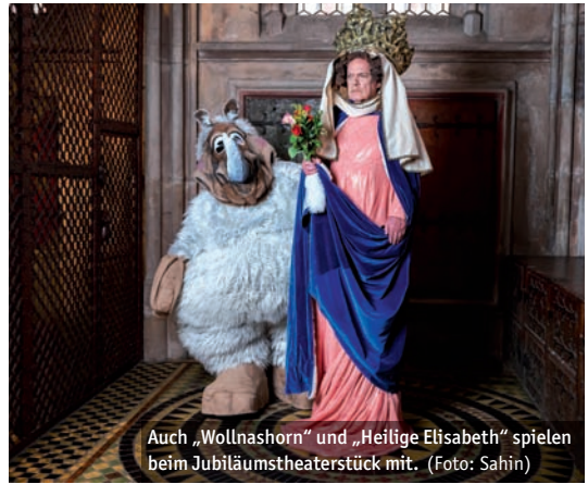
Auch „Wollnashorn“ und „Heilige Elisabeth“ spielen beim Jubiläumstheaterstück mit.