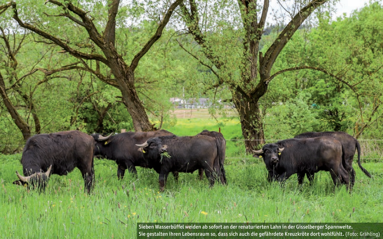
Sieben Wasserbüffel weiden ab sofort an der renaturierten Lahn in der Gisselberger Spannweite. Sie gestalten ihren Lebensraum so, dass sich auch die gefährdete Kreuzkröte dort wohlfühlt.