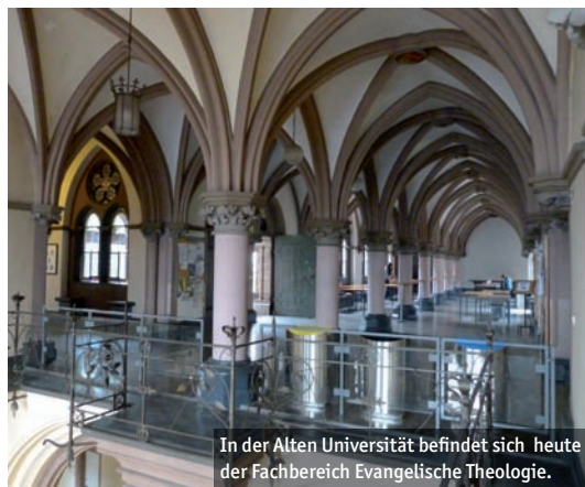
In der Alten Universität befindet sich heute der Fachbereich Evangelische Theologie.

Die frühere Marburger Studentin Hannah Arendt ist die Titelfigur der Veranstaltungsreihe, die noch bis zum 22. Juni läuft. Eine Grafik zeigt sie einmal kombiniert mit der Alten Universität, einmal mit den Türmen der Philosophischen Fakultät. „Damit wollen wir dazu anregen, die Studierenden und ihre Universität aus verschie-