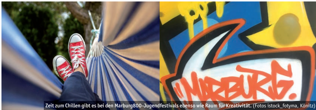
Zeit zum Chillen gibt es bei den Marburg800-Jugendfestivals ebenso wie Raum für Kreativität.

Produktion und Abschlusskonzert sowie Genres von Pop über Electro und Rock bis zu Rap und DJing. Hier kann Erlerntes präsentiert werden, und hier findet der Austausch zwischen Referent*innen, Teilnehmer*innen und Publikum statt. Den Höhepunkt des Festivals bildet die Nacht von Samstag auf Sonntag mit einer großen After-Show-Party im KFZ, um die neu gewonnenen (Er-)Kenntnisse auszuprobieren und zu feiern.