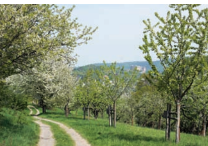
„NatUr ergründen“ kann man im Heiligen Grund bei Ockershausen.

„NatUr ergründen“ lautet der Titel der Veranstaltungsreihe, die der Naturschutzbund und der Verein „NatUrgrund“ in Kooperation mit der Stadt Marburg erarbeitet hat. Darin geben sie einen Einblick in die facettenreiche Tier- und Pflanzenwelt im Heiligen Grund bei Ockershausen. Die Reihe, die mit einer Vogelstimmenwanderung und einer Pflanzentauschbörse startete, setzt sich mit „Aha-Erlebnissen mit Asseln, Schnecken und Feuersalamandern“ am