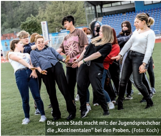
Die ganze Stadt macht mit: der Jugendsprecher die „Kontinentalen“ bei den Proben.