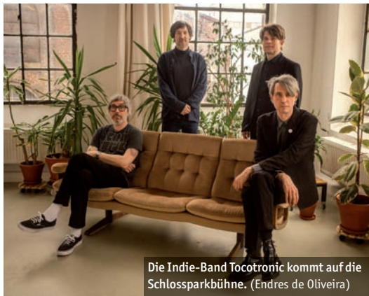
Die Indie-Band Tocotronic kommt auf die Schlossparkbühne. (Endres de Oliveira)