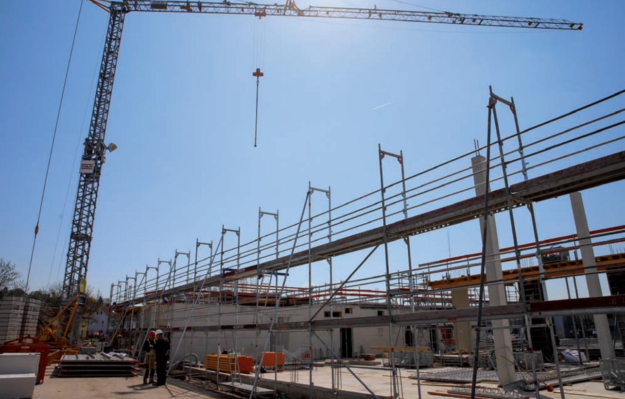
Neben der Hessischen Feuerweherschule in Cappel entsteht das neue Gebäude der Feuerwehr Cappel, das ein wichtiger Übungsort werden soll.