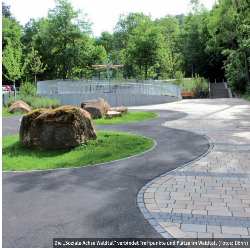
Die „Soziale Achse Waldtal“ verbindet Treffpunkte und Plätze im Waldtal.

Der neu gestaltete Fußgängerweg verbindet die Straßen St.-Martin-Straße und Fuchspass. Er führt von der Kindertagesstätte „Kleine Strolche“, neben der derzeit auch das neue Nachbarschaftszentrum Waldtal entsteht, hoch zum Bolzplatz. Doch es ist mehr als nur ein Weg: Es sind auch neue Spielmöglichkeiten für Kinder entstanden. Es gibt dort ein Klettergerüst, eine Bobbycar-Renn-