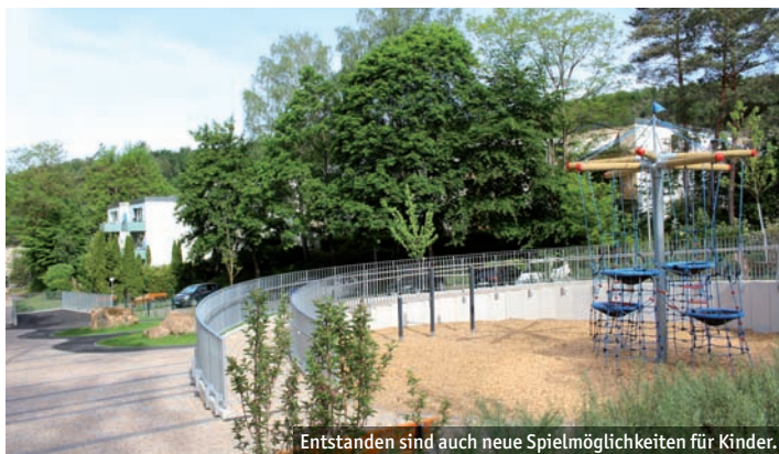
Entstanden sind auch neue Spielmöglichkeiten für Kinder.

Der gesamte Weg wurde erweitert, nach oben hin wird er nun trichterförmig immer breiter. Ziel war es, ihn zu jeder Tageszeit für alle nutzbar zu machen und damit auch den Zugang zum Bolzplatz zu erleichtern. Die Gesamtmaßnahme kostet etwa 800.000 Euro, 480.000 Euro stammen aus Fördermitteln aus dem Programm „Sozialer Zusammenhalt“ von Bund und dem Land Hessen.