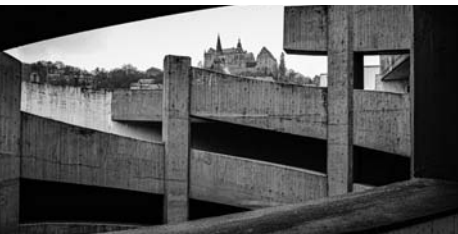
Den Blick auf Marburger Architektur des Brutalismus richtet Susanne Saker mit Ausstellung und mehr.