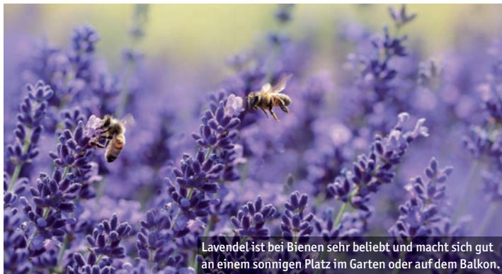
Lavendel ist bei Bienen sehr beliebt und macht sich gut an einem sonnigen Platz im Garten oder auf dem Balkon.

Der Wettbewerb soll eine Anregung sein, auch über das Jubiläumsjahr hinaus die biologische Vielfalt in Marburgs Gärten, Vorgärten und auf den Balkonen zu fördern. „Die Stadt Marburg möchte nachhaltig dazu anregen, dass Unternehmen, Institutionen und Bürger*innen bei der Gestaltung ihrer privaten Grundstücke umdenken