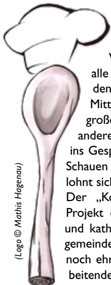
(Logo © Mathis Hagenau)

Der „Kochlöffel“ ist ein Projekt der evangelischen und katholischen Kirchengemeinde. Wir suchen noch ehrenamtliche Mitarbeitende, die das Projekt