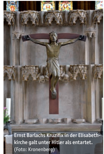
Ernst Barlachs Kruzifix in der Elisabethkirche galt unter Hitler als entartet.