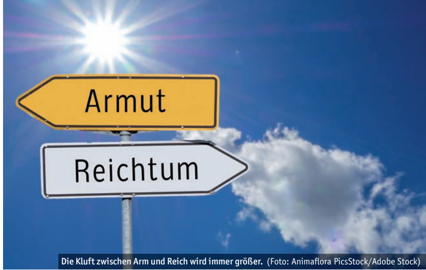
Die Kluft zwischen Arm und Reich wird immer größer.