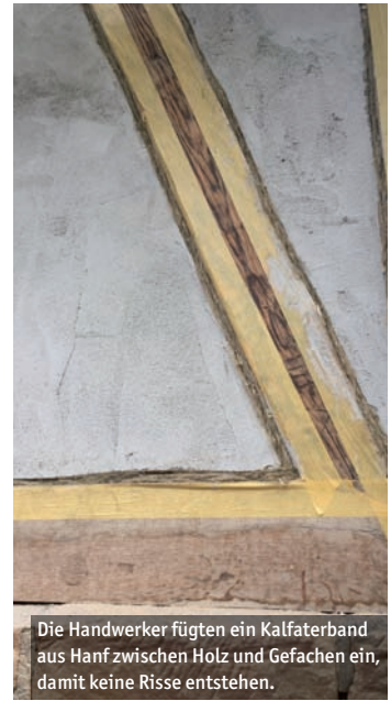
Die Handwerker fügten ein Kalfaterband aus Hanf zwischen Holz und Gefachen ein, damit keine Risse entstehen.

Deswegen arbeiteten die Fachleute mit ursprünglichen Materialien, die das Fachwerk atmen lassen und zugleich Schimmelbildung verhindern. Die Handwerker fügten zudem ein Hanfband zwischen Holz und Gefachen ein, damit keine Risse entstehen, wenn sich die Materialien zum Beispiel durch Temperaturunterschiede ausdehnen oder zusammenziehen. Das Fachwerkhaus des Ehepaars ist Teil des historischen Ensembleschutzes des Dorfkerns Michelbach. Das bedeutet, dass die äußere Erscheinung weitgehend den Originalzustand der Erbauungszeit wiedergeben muss. Bei der Gestaltung orientierten die beiden sich an alten Fotografien aus