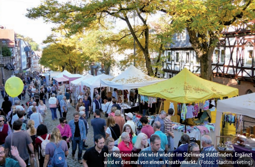
Der Regionalmarkt wird wieder im Steinweg stattfinden. Ergänzt wird er diesmal von einem Kreativmarkt.