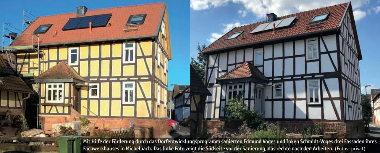
Mit Hilfe der Förderung durch das Dorfentwicklungsprogramm sanierten Edmund Voges und Inken Schmidt-Voges drei Fassaden ihres Fachwerkhauses in Michelbach. Das linke Foto zeigt die Südseite vor der Sanierung, das rechte nach den Arbeiten.