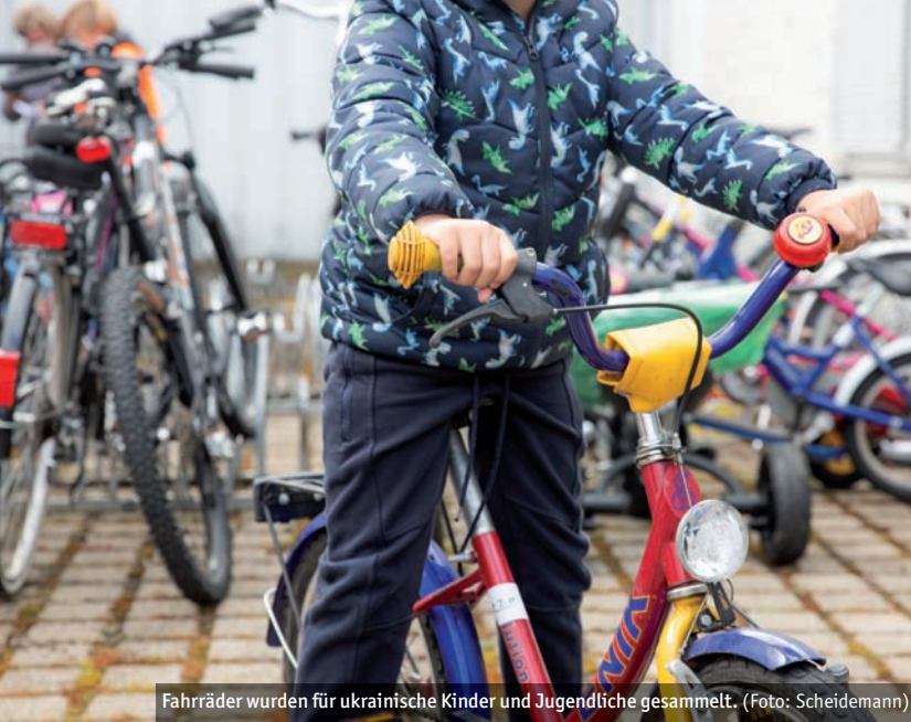
Fahrräder wurden für ukrainische Kinder und Jugendliche gesammelt.