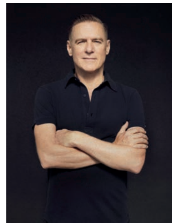
Der Rockmusiker Bryan Adams ist seit vielen Jahren auch erfolgreicher Fotograf.

Bryan Adams wurde 1959 in Ontario geboren. Bekannt ist er vor allem als kanadischer Rocksänger, Komponist und Gitarrist. Seit 1983 erreichte er in mehr als 30 Ländern mit Hits wie „Summer of 69“ Nummer-Eins-Platzierungen. Neben der Musik ist er ein leidenschaftlicher und erfolgreicher Fotograf. „Interview“, „i-D“, „Harper’s Bazaar“ und die britische und deutsche „Vogue“ sind nur eine Auswahl der Magazine, für die er Fotografien anfertigte. 2003 gründete er das Zoo Magazine, in dem er Mode- und Porträtfotografie präsentiert.