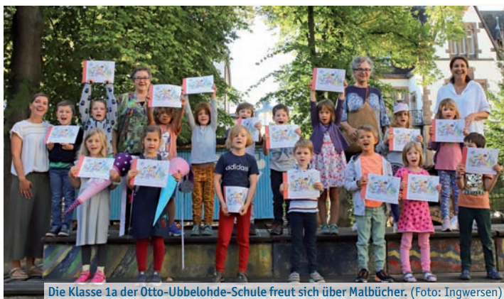
Die Klasse 1a der Otto-Ubbelohde-Schule freut sich über Malbücher.