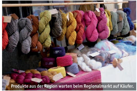
Produkte aus der Region warten beim Regionalmarkt auf Käufer.

schen Einlagen gibt es Märchenlesungen, Mitmach-Workshops und eine Menge an Möglichkeiten, der Kreativität freien Lauf zu lassen. „Mit dieser Aktion möchten wir ein Angebot für die Familien in der Oberstadt schaffen“, so Nadine Kümmel.