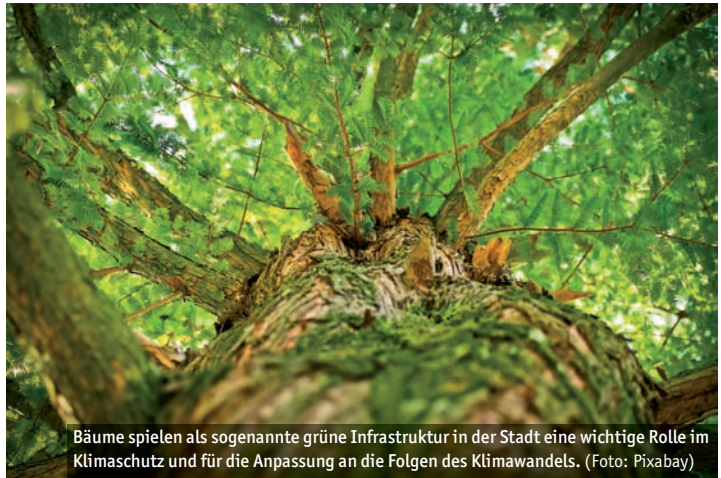
Bäume spielen als sogenannte grüne Infrastruktur in der Stadt eine wichtige Rolle im Klimaschutz und für die Anpassung an die Folgen des Klimawandels.

„Wir brauchen Bäume in der Stadt, um uns vor Hitze zu schützen und die Aufenthaltsqualität in der Stadt zu erhöhen. Gleichzeitig müssen wir auch die Bäume selbst vor den Auswirkungen des Klimawandels schützen“, stellt Stadtrat Kopatz fest. In diesem und weiteren Bereichen wird das Anpassungskonzept der Stadt Marburg angesetzt. Für das Konzept wurden eine Stadtklimaanalyse (Hitzebelastung und Kaltluftzufuhr) und eine Simulation des Regenwasserabflusses modelliert. Aufbauend auf der Analyse wird derzeit ein Handlungskonzept erstellt, das Maßnah-