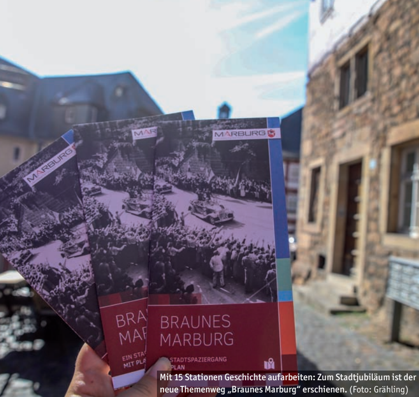
Mit 15 Stationen Geschichte aufarbeiten: Zum Stadtjubiläum ist der neue Themenweg „Braunes Marburg“ erschienen.