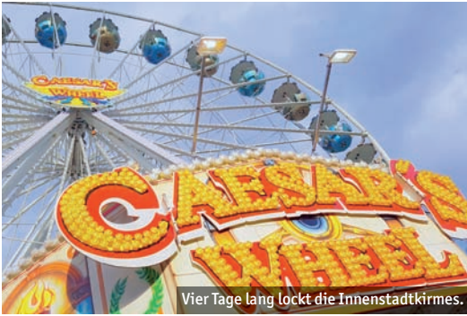
Vier Tage lang lockt die Innenstadt kirmes.