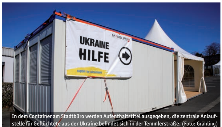
In dem Container am Stadtbüro werden Aufenthaltstitel ausgegeben, die zentrale Anlaufstelle für Geflüchtete aus der Ukraine befindet sich in der Temmlerstraße.

der Ukraine eingerichtet. Sie wurde mit der aus Armenien stammenden Marburger Ausländerbeiratsvorsitzenden und Russisch-Muttersprachlerin Goarik Gareyan besetzt. Persönliche Vorsprache bei der Ukrainehilfe der Stadtverwaltung ist ohne Anmeldung immer montags von 8 bis 11 Uhr in der Temmlerstraße 5 möglich. Dort gibt es Hilfe bei der Suche