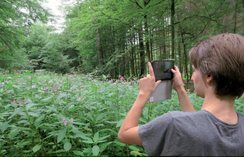
Rund 100 Schüler*innen waren bereits auf dem „Senso-Trail“.