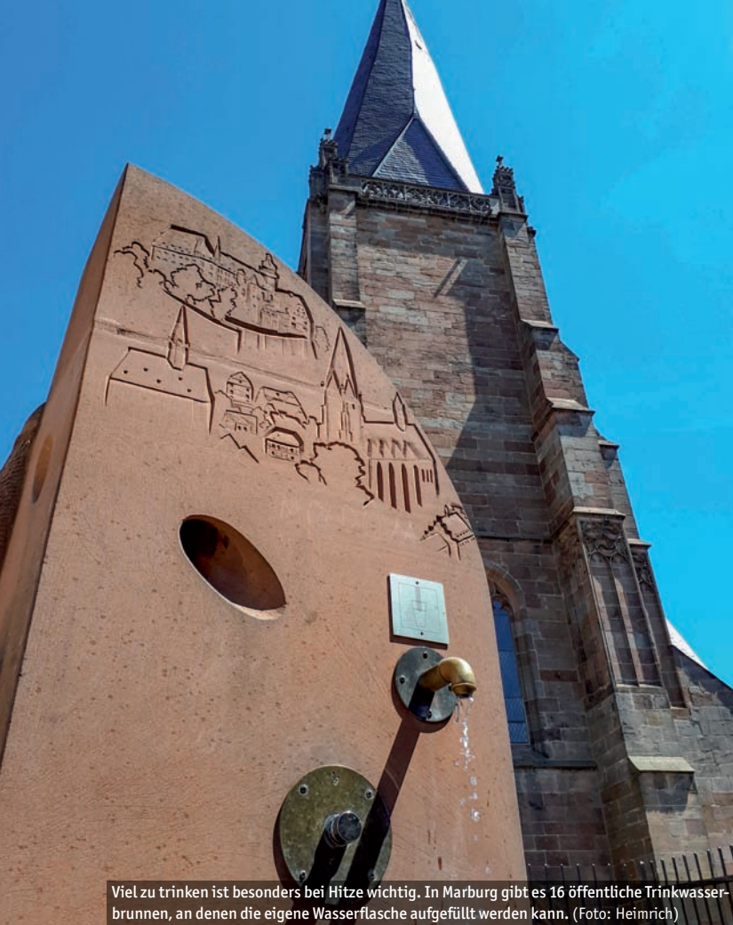
Viel zu trinken ist besonders bei Hitze wichtig. In Marburg gibt es 16 öffentliche Trinkwasserbrunnen, an denen die eigene Wasserflasche aufgefüllt werden kann.