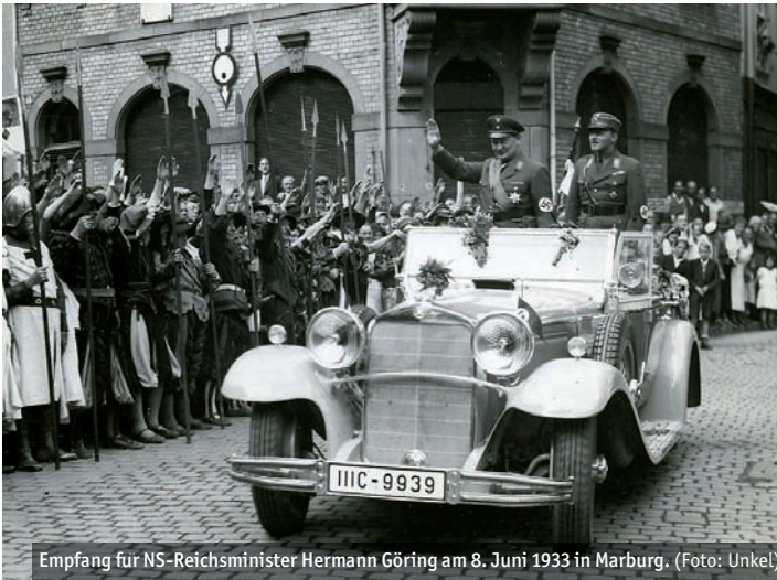
Empfang für NS-Reichsminister Hermann Göring am 8. Juni 1933 in Marburg.