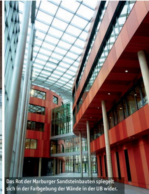
Das Rot der Marburger Sandsteinbauten spiegelt sich in der Farbgebung der Wände in der UB wider.

D ie neue Marburger Universitätsbibliothek - kurz UB - wird zu Beginn des Sommersemesters für Besucherinnen und Besucher geöffnet. Damit erhält das Herz des Campus Firmanei einen kulturellen Treffpunkt - nicht nur für Studierende.