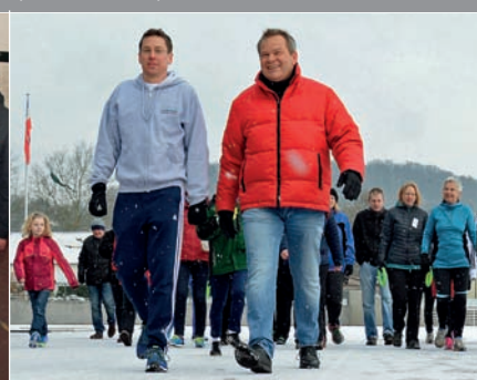
Weltkrebstag: Im Georg-Gaßmann-Stadion gehen Bürgerinnen und Bürger mit dem OB „3000 Schritte“.