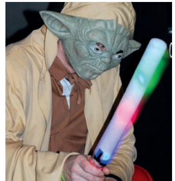
Meister Yoda erwartet junge Padawane zur Jedi-Prüfung in der Stadtbücherei Marburg.

Marburg • Tel. 06421-64060 • www.eckhardt-marburg.de