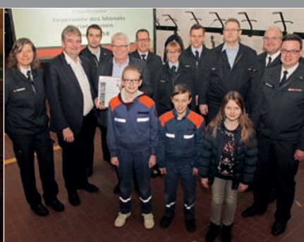
Feuerwehr des Monats: Für die Imagefilme „Superheld“ und „Alltagsheld“ geht der Titel nach Marburg.