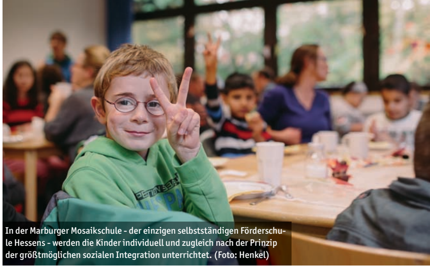
In der Marburger Mosaikschule - der einzigen selbstständigen Förderschule Hessens - werden die Kinder individuell und zugleich nach der Prinzip der größtmöglichen sozialen Integration unterrichtet.

Als Teil des allgemeinen, staatlichen Schulwesens ist die Mosaikschule als gebundene Ganztagschule konzipiert. Die Unterrichtsangebote rich-