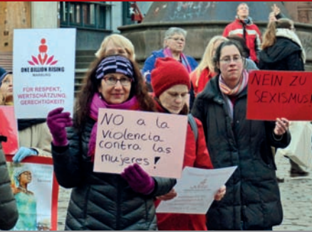
One Billion Rising: Auf dem Markt demonstrieren gut 120 Menschen tanzend gegen Gewalt an Frauen.