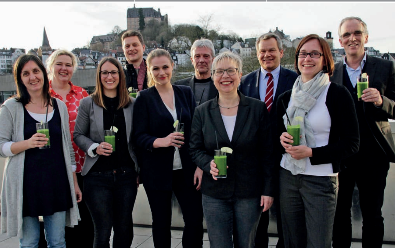
Marburg als Standort für umweltfreundliches und nachhaltiges Tagen: Die Initiative „Green Meetings & Events in Marburg Stadt und Land“ mit Akteuren aus der Tagungsbranche geht an die Öffentlichkeit. Ziel ist es, die Region als Destination für nachhaltiges Tagen zu etablieren und neue Kunden zu gewinnen, so die Initiatoren.