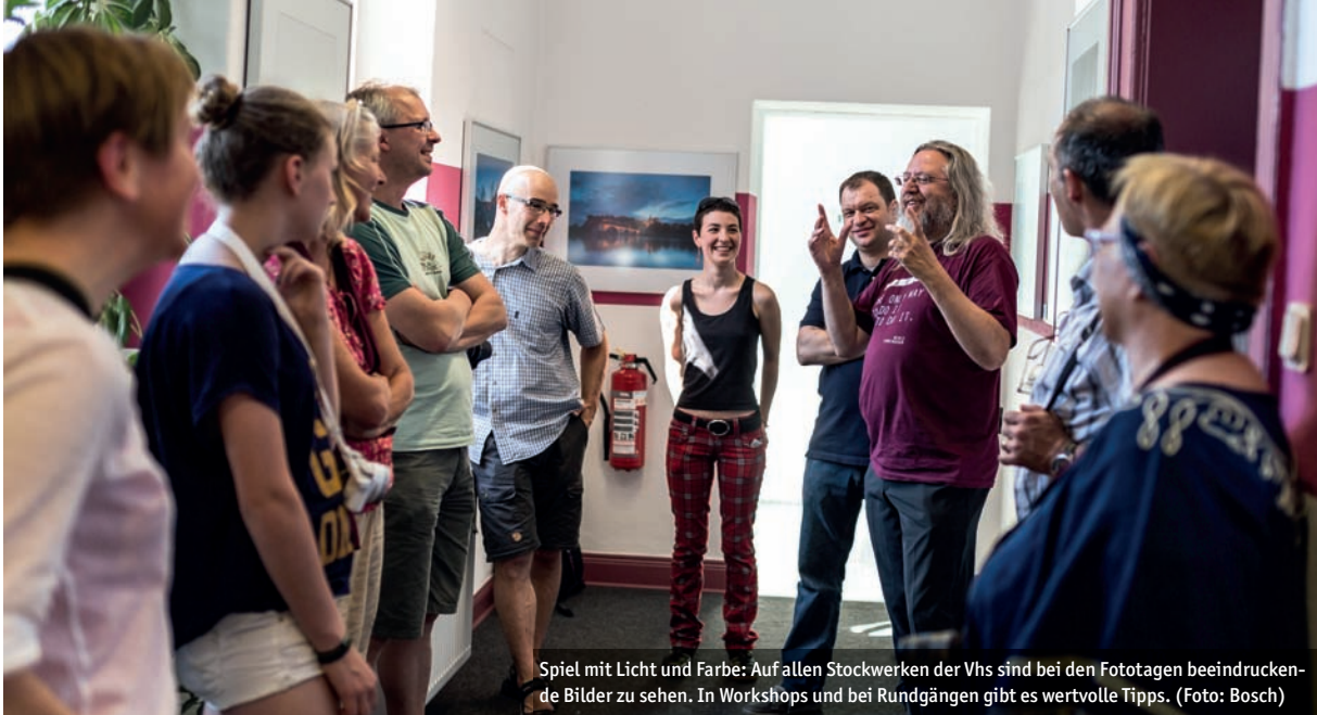
Spiel mit Licht und Farbe: Auf allen Stockwerken der Vhs sind bei den Fototagen beeindruckende Bilder zu sehen. In Workshops und bei Rundgängen gibt es wertvolle Tipps.