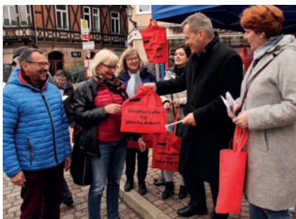
Das Gleichberechtigungsreferat der Stadt informiert Mitte März wieder beim Equal Pay Day über Lohnunterschiede.

merksam gemacht. Das Gleichberechtigungsreferat der Stadt Marburg wird am Samstag, 17. März, von 10 bis 12 Uhr mit einem Info-Stand auf dem Marktplatz informieren und rote Taschen als sichtbares Zeichen gegen die ungleiche Bezahlung verteilen. Außerdem dokumentiert der Hessische Lohnatlas, der seit 2017 vorliegt, die Lohnunterschiede in Marburg-Biedenkopf. Das Referat der Stadt weist zudem darauf hin, dass es noch im ersten Halbjahr 2018 ein Workshop für Frauen organisiert, in dem Frauen für Gehaltsverhandlungen fit gemacht werden. Weitere Informationen gibt es unter (06421) 201-1377 oder im Internet auf www.marburg.de/equalpayday2018