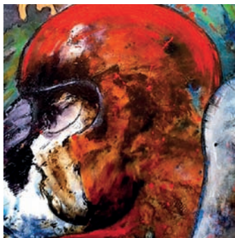
Die vierte Ausstellung wird in der Galerie 36 des Jugendamtes gezeigt.