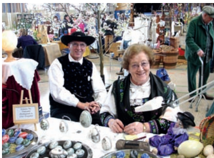
Moischt lädt Gäste aus ganz Marburg zum Jubiläumsostermarkt ein.

Der Geflügelzuchtverein Moischt lädt zu seinem 30. österlichen Brauchtumsmarkt in die Mehrzweckhalle des Stadtteils ein. Über 40 Aussteller zeigen am ersten Märzwochenende liebevoll gefertigte Erzeugnisse: Mineralien Schmuck, Töpferwaren, Fotokarten, Heutiere, Holz- und Papier-