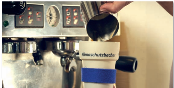
Der Marburger Klimaschutzbecher findet bundesweit Beachtung. Mit dem Preisgeld werden jetzt unter anderem weitere Mehrwegbecher angeschafft.

Nach Angaben des Statistischen Bundesamts verdienen Frauen 2017 immer noch 21 Prozent weniger als Männer bei gleicher oder gleichwertiger Arbeit. Deshalb wird auch 2018 am „Equal pay Day“ unter dem Motto „Transparenz gewinnt“ auf diese Benachteiligung im Erwerbsleben auf-