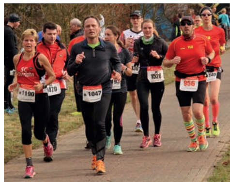
Zum Lahntallauf in den Marburger Lahnen erwartet der Ultra Sport Club Marburg am 3. März wieder bis zu 1000 Starterinnen und Starter.

Das Ende des Winters bietet eine gute Gelegenheit, die eigene Fitness auf einer flachen Strecke unter freiem Himmel zu testen. Dafür bietet der Lahntallauf des Ultra Sport Clubs Marburg am Samstag, 3. März, wieder eine gute Gelegenheit. Auf einem Zehn-Kilometer-Rundkurs an der Lahn mit drei Verpflegungsstellen werden neben dem Ultramarathon über 50 Kilometer auch der Marathon, Halbmarathon sowie Strecken über 30 und 10 Kilometer angeboten. Start ist um 10 Uhr an den Lahnwiesen auf der Höhe Südbahnhof, Zielschluss ist um 16 Uhr. Anmeldung, Umkleiden, Duschen, Toiletten und Bewirtung gibt es in der großen Sporthalle am Georg-Gaßmann-Stadion. Für alle Teilnehmenden