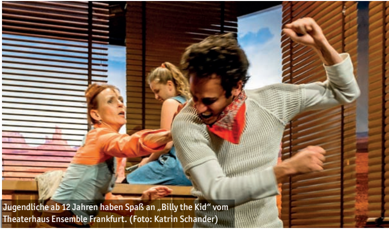
Jugendliche ab 12 Jahren haben Spaß an „Billy the Kid“ vom Theaterhaus Ensemble Frankfurt.