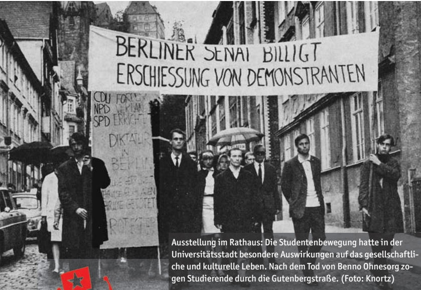
Ausstellung im Rathaus: Die Studentenbewegung hatte in der Universitätsstadt besondere Auswirkungen auf das gesellschaftliche und kulturelle Leben. Nach dem Tod von Benno Ohnesorg zogen Studierende durch die Gutenbergstraße.