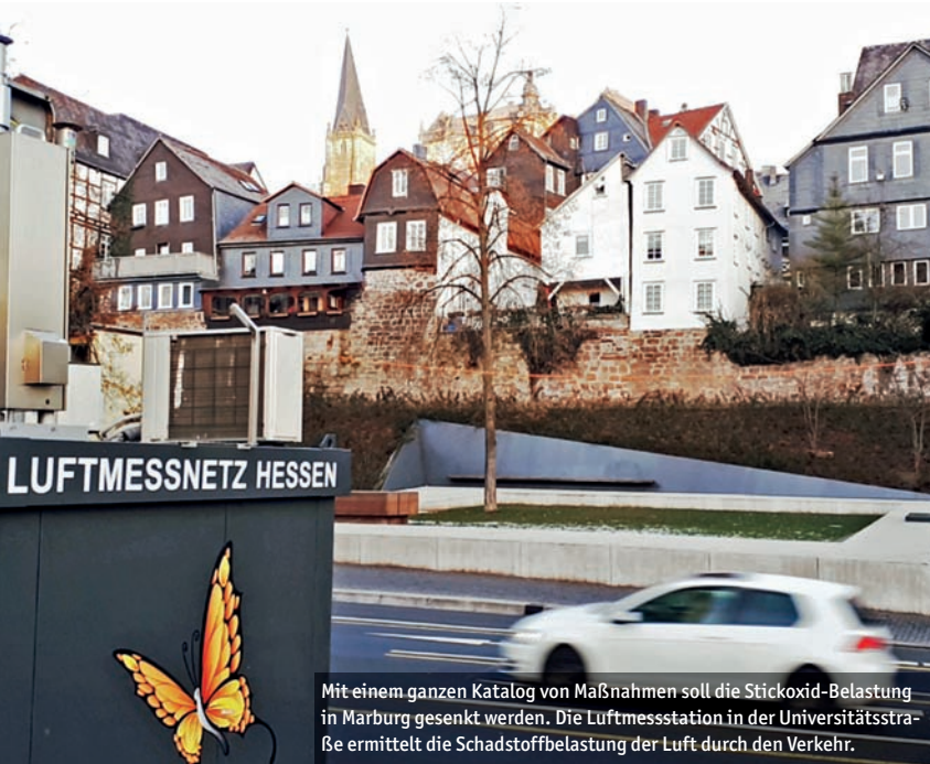
Mit einem ganzen Katalog von Maßnahmen soll die Stickoxid-Belastung in Marburg gesenkt werden. Die Luftmessstation in der Universitätsstraße ermittelt die Schadstoffbelastung der Luft durch den Verkehr.