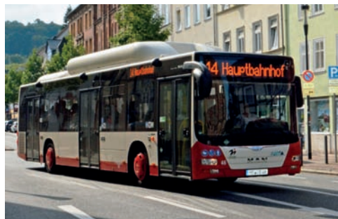
Schon 60 Prozent der Marburger Busse fahren umweltfreundlich mit Erdgas.

Bessere Luft in der Universitätsstadt Marburg – daran arbeiten die Stadtwerke Marburg. Mit einem innovativen und nachhaltigen Mobilitätskonzept, das sich vor allem in der Modernisierung der Fahrzeugflotte zeigt, leistet das Unternehmen einen entscheidenden Beitrag zur Verbesserung der lokalen Luftqualität. In den vergangenen zwei Jahren haben die Stadtwerke rund sechs Millionen Euro in die Modernisierung investiert. Etwa 60 Prozent der gesamten Busflotte fährt mittlerweile mit dem umweltschonenden Kraftstoff Erdgas, das einen deutlich niedrigeren Schadstoffausstoß als herkömmliche Euro-6-Fahrzeuge aufweist. Weitere Investitionen sind 2018 vorgesehen. Die schadstoffarmen Erdgasbusse stoßen ein Drittel weniger Stickoxide aus als herkömmliche Dieselfahrzeuge. Der Rückgang beim giftigen Stickstoffdioxid beträgt sogar über