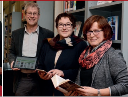
Bilanz: Immer mehr Menschen nutzen das Onleihe-Angebot der Stadtbücherei Marburg.