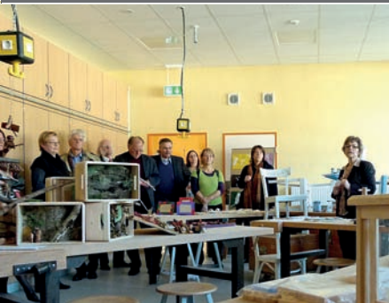
„Fast wie neu“: Der Fachtrakt der Pestalozzischule wurde grundlegend saniert (11.11.11)