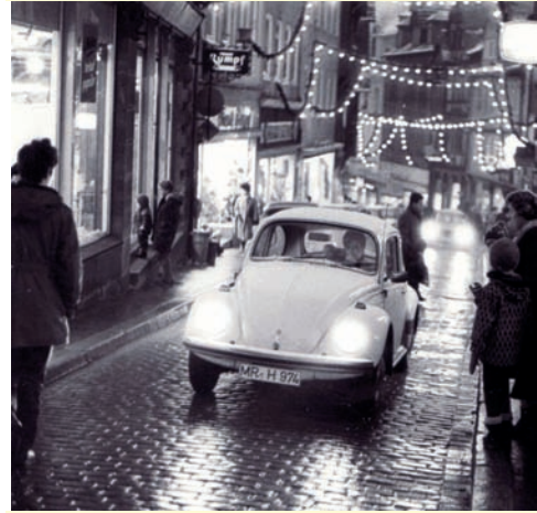
Weihnachtsbummel in der Oberstadt – einst und jetzt

Das historische Rathaus inmitten der weihnachtlich erleuchteten Altstadt und die Elisabethkirche mit ihrer imposanten Architektur bieten das beeindruckende Ambiente für gleich zwei weihnachtliche Märkte. Gleich anschließend an die lange Einkaufsnacht Marburg b(u)y Night“ mit ihren eindrucksvollen Lichtinstallationen am 25. November sind die Weihnachtsmärkte vom 26. November bis zum 23. Dezember durchgängig geöffnet. Täglich von