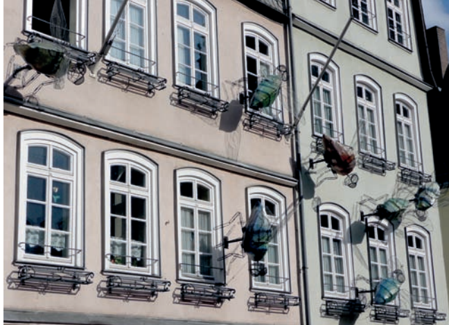
Die „Sieben Fliegen“ werden auch beim Themenjahr Grimm wieder eine Rolle spielen

Zum Schluss noch ein kurzer Ausblick auf das neue Jahr: 2012 jährt sich das Erscheinen der „Kinder- und Hausmärchen“ der Brüder Grimm zum 200. Mal. Es gibt kaum jemanden, dem die Märchensammlung der Brüder Grimm kein Begriff ist, sie gehört auch zum UNESCO-Weltdokumentenerbe. Und da Jacob und Wilhelm Grimm in Marburg studiert haben und damit eine wichtige Phase ihres Lebens in unserer Stadt verbracht haben, wird es im nächsten Jahr ein „Themenjahr Grimm“ geben. Unter dem Motto: „7 auf einen Streich“ wird unter Federführung des