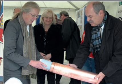
Anschließend eingemauert: Die Grundstein-Utensilien für den neuen Forschungsbau des Zentrums für Tumor- und Immunbiologie (25.10.11)