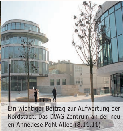
Ein wichtiger Beitrag zur Aufwertung der Nordstadt: Das DVAG-Zentrum an der neuen Anneliese Pohl Allee (8.11.11)