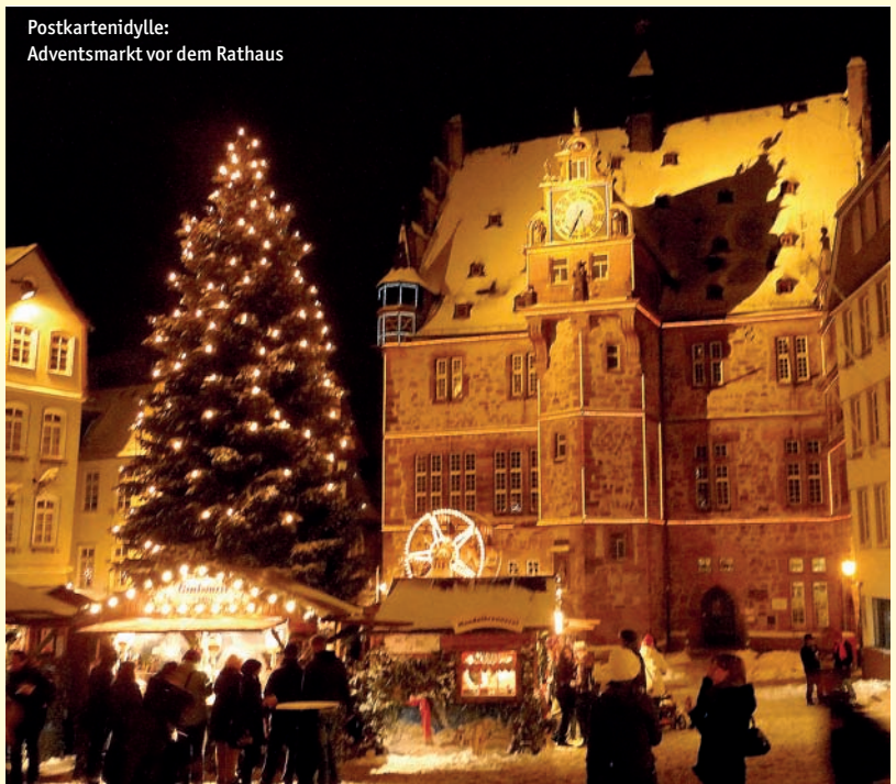
Postkartenidylle: Adventsmarkt vor dem Rathaus

11 bis 20 Uhr, sonntags von 12 bis 20 Uhr können in den malerischen Holzbuden allerlei Geschenkideen von Holz- und Lederprodukten über Kerzen, Lampen, Woll- und Töpferwaren bis hin zu Kosmetik, Schmuckartikeln und Spielzeug erworben werden. Natürlich wird es auch Glühwein und andere wärmende Getränke sowie verschiedene süße und herzhafte Leckereien geben. Am Rathaus können die kleinen Besucher kostenlos das Kinderriesenrad besteigen, an der Elisabethkirche wird eine große Weihnachtspyramide zu bestaunen sein, und wechselnde Auftritte von regionalen Chören und Musikgruppen werden auf