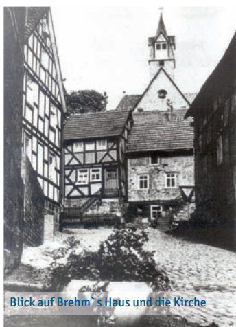
Blick auf Brehm`s Haus und die Kirche

diesmal bis zum 10. Dezember, wissen. Unser Preis für das heutige Suchbild: Marburg-Nord in alten Ansichten – MSS 14. Rainer Kieselbach