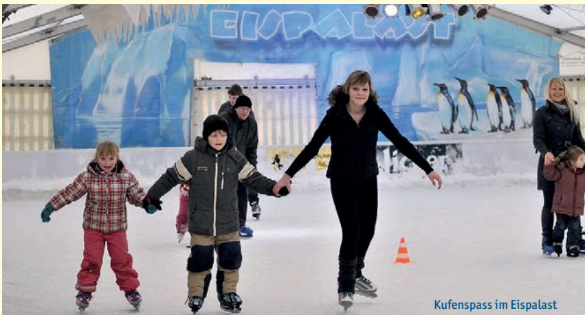
Kufenspass im Eispalast

che Sonderaktionen wie Eislauftraining, Eishockeyturniere und Showprogramme laden vom 9. Dezember bis zum 22. Januar Neulinge und alte Hasen ein, sich aufs Eis zu wagen. Schlittschuhe können gegen Gebühr vor Ort ausgeliehen werden.