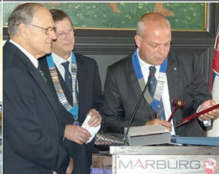
Ein halbes Jahrhundert unter dem Motto We serve / „Wir dienen“ - der Marburger Lions-Club feiert im Rathaus (21.10.11)