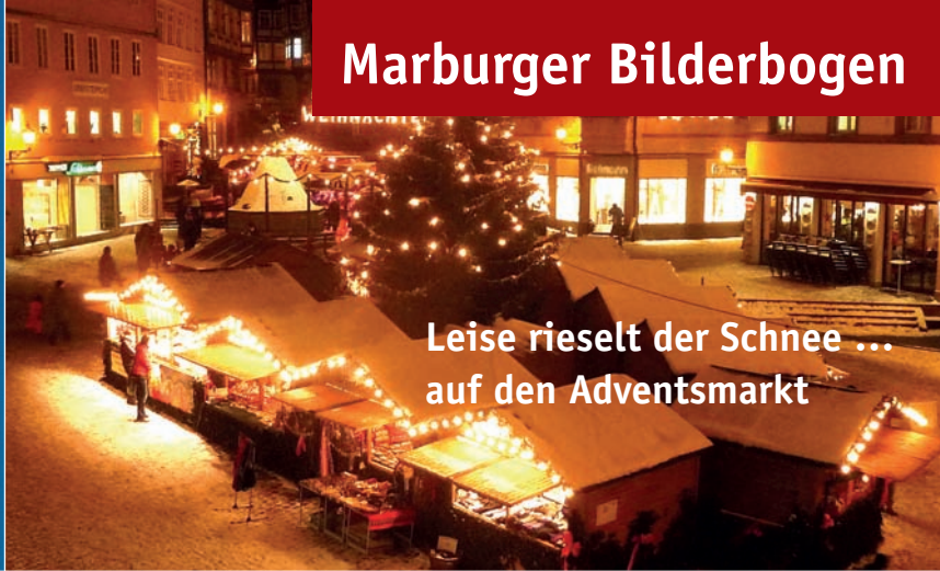
Leise rieselt der Schnee ... auf den Adventsmarkt