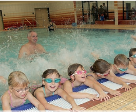
Wasserspaß im neuen Gesundheits- und Lehrbecken des Hallenbads Wehrda (4.11.11)