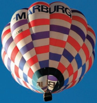
Alles dreht sich um Marburg