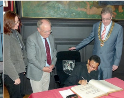
Gospelfeeling im Rathaus, Lilian Bouttè, musikalische Botschafterin von New Orleans, trägt sich ins Goldene Buch ein (17.10.11)