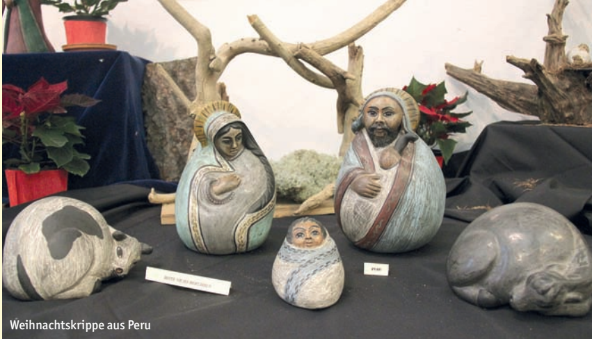
Weihnachtskrippe aus Peru

Ein besonderes Vergnügen im winterlichen Kulturangebot bietet zweifellos auch der Eispalast am Aquamar in der Sommerbadstraße. Ein Zelt mit 500 m 2 Eisfläche, ein beheizter Cafébereich mit verschiedenen Speiseangeboten und zahlrei-